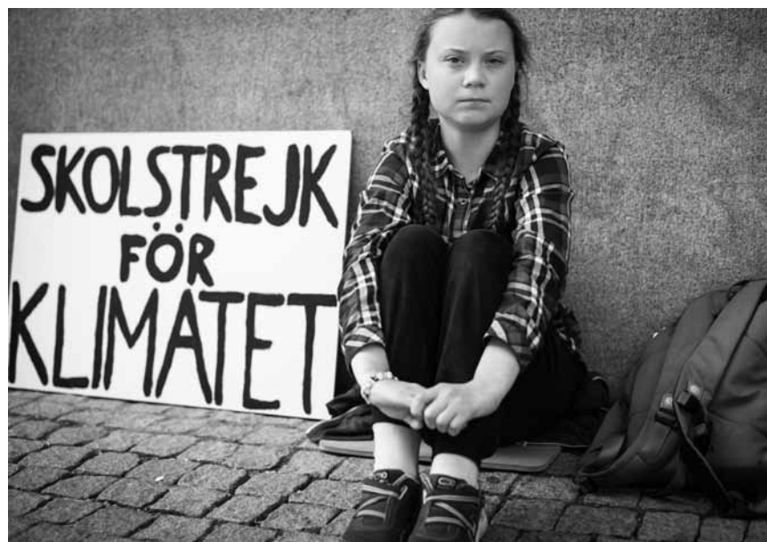
„I Am Greta“ ist ein Dokumentarfilm über die wohl bekannteste Jugendliche weltweit - zu sehen im Utopia.

Wiebke betreibt nicht nur einen eigenen Reiterhof, auf dem unter anderem Polizeipferde trainiert werden, sondern adoptierte mit Nicolina auch schon einmal ein osteuropäisches Mädchen - mit Erfolg. Ihr neuer Schützling, die fünfjährige Raya, macht es ihr da nicht ganz so einfach. Sie beschmiert das Bad