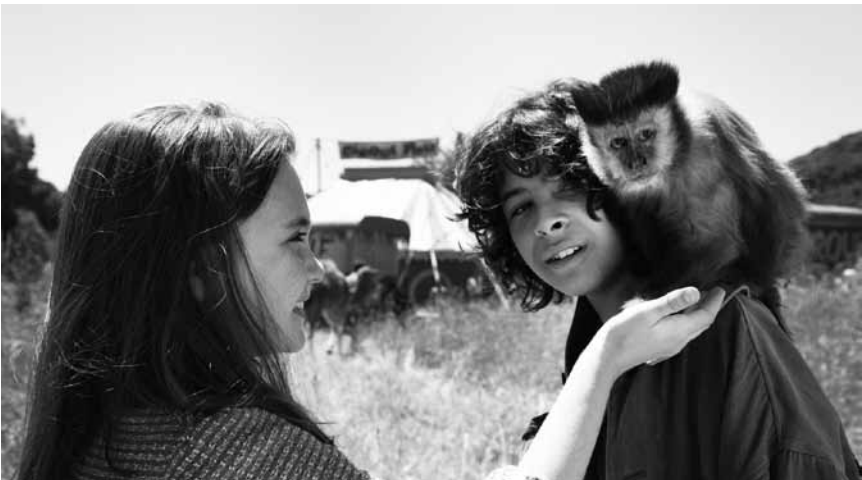
Un poney en danger : dans « Poly », deux amis essaient de sauver une vedette à quatre sabots. Aux Kinepolis Belval et Kirchberg.

Peter ist begeistert, dass sein Großvater nach dem Tod seiner Frau zu ihm und seiner Familie ziehen soll. Doch die Freude endet jäh, als dieser ihm sein Zimmer wegnimmt und Peter auf den unheimlichen Dachboden ziehen muss. So sehr er seinen