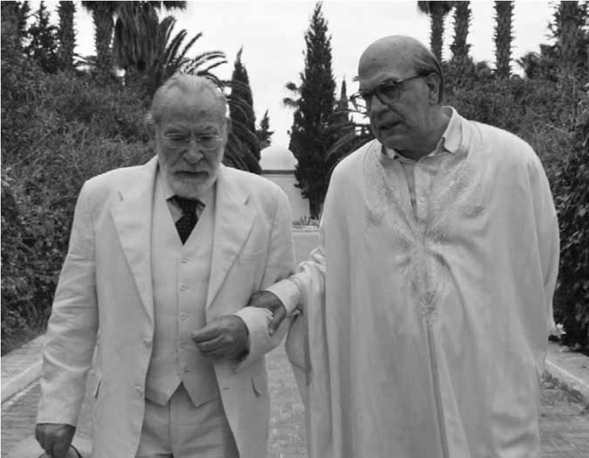
« Hammamet » montre les derniers mois du politicien et premier ministre italien Bettino Craxi, exilé à Hammamet en Tunisie après un scandale de corruption. Au Kinosch le 4 novembre à 20h30 et au Starlight le 6 novembre à 19h.