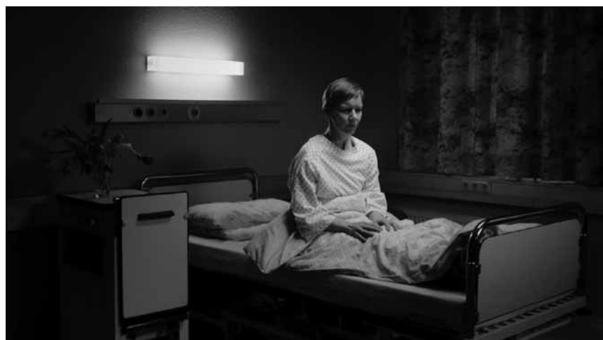
In „Schlaf“ treiben Alpträume eine Frau in den Wahnsinn und zum folgenreichen Nervenzusammenbruch – im Kulturhuf Kino, Scala, Sura und Orion.