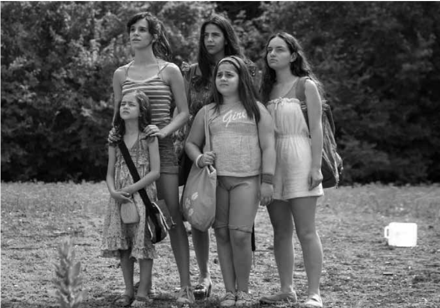
« Le sorelle Macaluso » se situe dans la banlieue de Palerme et suit cinq sœurs de l'adolescence à l'âge adulte et à la vieillesse, dans un univers exclusivement féminin. Au Kinosch, le 6 novembre à 20h30.

Anita a 17 ans et vit dans un village du centre de la Sardaigne, tout près d'une zone militaire où, comme ailleurs dans l'île, les forces alliées font des essais d'armes nouvelles. Sa mère est décédée d'une leucémie, comme bien d'autres personnes dans la région. Elle habite avec son père, Jacopo, qui est à son tour atteint par la maladie. Il a besoin d'une greffe osseuse mais Anita n'est pas compatible, pas plus que Tonino, son grand-père. Ce dernier essaie vainement de renouer avec son