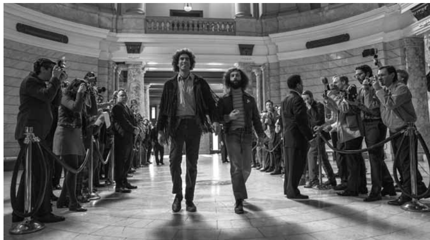
Hippies vor Gericht: „The Trial of the Chicago 7“ spielt während des Vietnamkriegs und thematisiert die Demonstrationen der Hippie-Kultur, die mit der Anklage von sieben vermeintlichen Rädelsführern einhergeht – im Kinepolis Belval und Kirchberg.

Die Addams-Familie ist morbide, mysteriös und ziemlich verrückt. Dementsprechend fällt es der Familie nicht gerade leicht eine neue Bleibe zu finden, die auch wirklich zu ihnen passt. Die finstere Bude, in der sich der Addams-Klan auf Anhieb pudelwohl fühlt, steht jedoch ausgerechnet inmitten einer