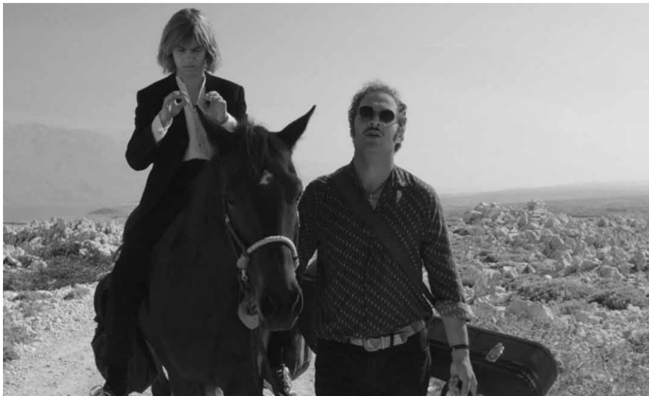
Dans « Tutto il mio folle amore », un enfant autiste se cache dans la voiture de son père biologique, qu'il ne connaît pas encore. Ensemble, ils feront un voyage de l'Italie aux Balkans – à voir au Kinosch, le 2 novembre à 20h30.

autre fils, Gaetano pour qu'il accepte de faire le test de compatibilité.