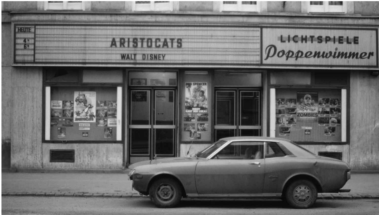
„Kino Welt Wien“ ist nach Angabe des österreichischen Filmarchivs eine Online-Ausstellung zur „Kulturgeschichte städtischer Traumorte“. Es geht um das Kino als Infrastruktur und magischen Raum.