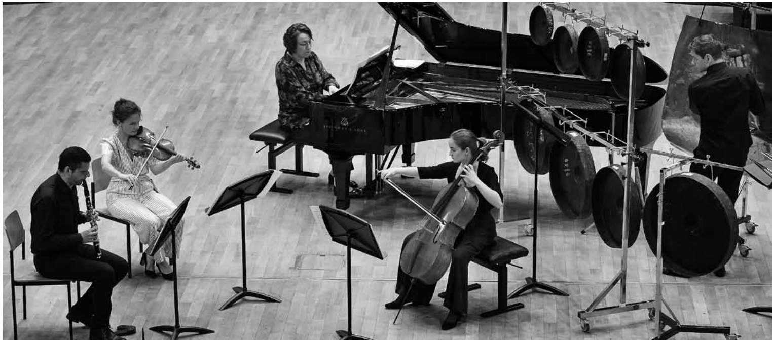
L'ensemble Kammerata Luxembourg lors de l'enregistrement de son nouveau CD.