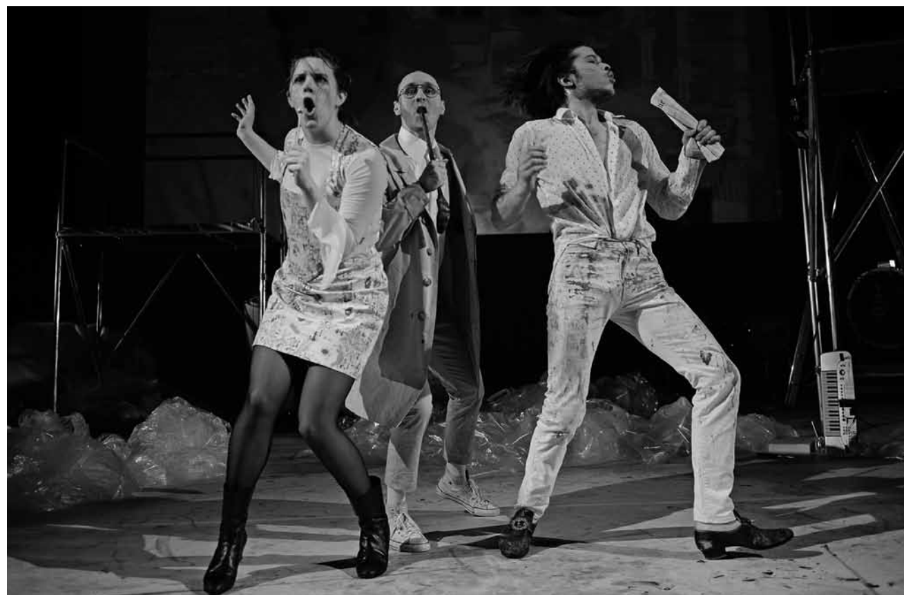
Das Maxim Gorki Theater bringt Hamlet auf die Bildschirme: „Die Hamletmaschine“, von Heiner Müller, ist am 10., 12. und 13. Februar um 19h30 online zu sehen.

Ateliers photographiques , avec Patrick Galbats, dans le cadre de la « World Press Photo Exhibition », Neimënster, Luxembourg , 8h. Tél. 26 20 52-1. www.neimenster.lu Inscription obligatoire : fabienne.bernardini@zpb.lu