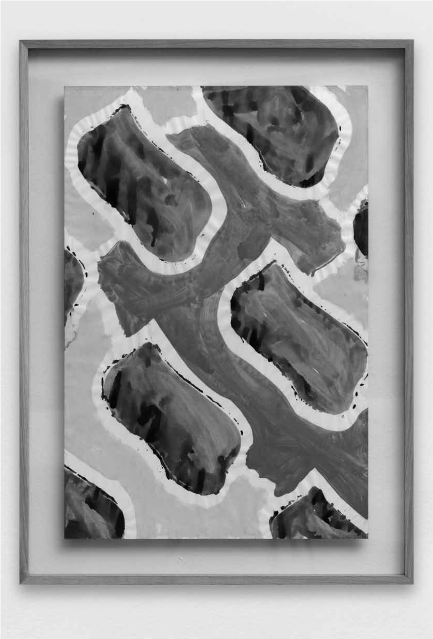
Claude Viallat « [d]ans tous les sens » : jusqu'au 20 mars, la galerie Ceysson & Bénétière présente les techniques mixtes de l'artiste contemporain.

Mon trésor - Europas Schatz im Saarland Objekte der Archäologie, Technik und Kunst von den Kelten bis heute, Weltkulturerbe Völklinger Hütte (Rathausstraße 75-79. Tel. 0049 6898 9 10 01 00), vom 19.3. bis zum 27.6., täglich 10h - 18h.