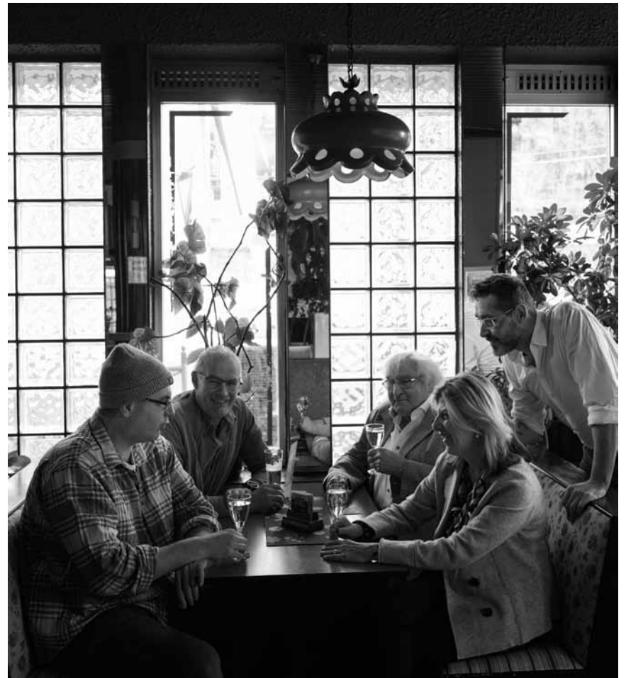
„Si mer nach ze retten?“ Déi Fro gött sech en Dönschdeg, de 4. Mee an e Mëttwoch, de 5. Mee um 20 Auer am Escher Theater gestallt.