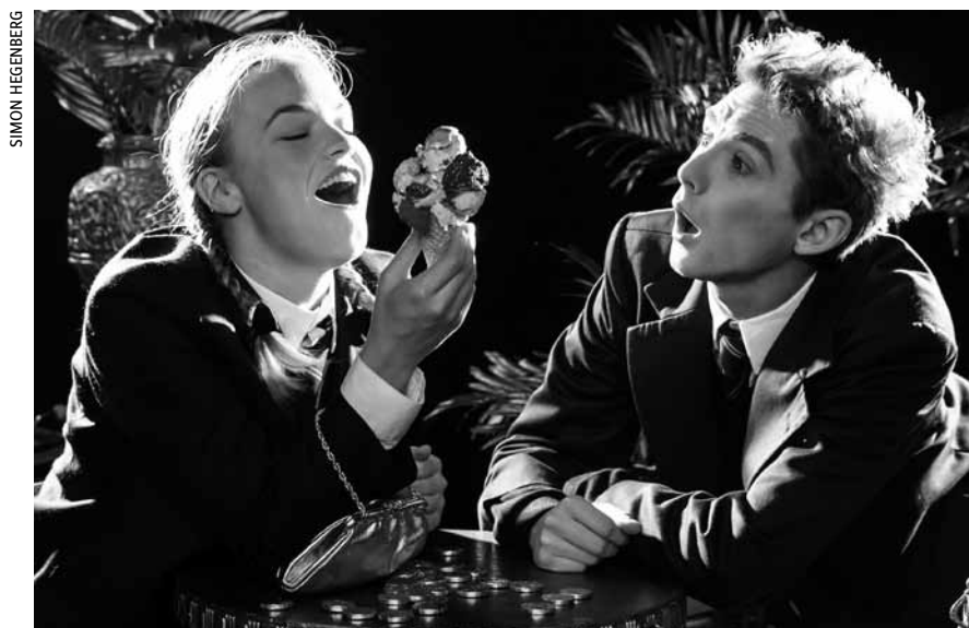
„Pünktchen und Anton“ werden am Sonntag, dem 16. Mai um 16 Uhr die Bühne im Cube 521 unsicher machen.