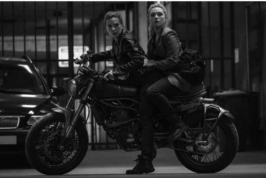
Scarlett Johansson ist als „Black Widow“ auf dem Motorrad wieder unterwegs durchs Marvel-Universum. In allen Kinos.

Die junge Jägerin in Ausbildung Robyn Goodfellowe reist mit ihrem Vater Bill nach Irland, um das letzte Wolfsrudel auszuroten. Während Robyn die verbotenen Gebiete außerhalb der Stadtmauern erkundet, freundet sie sich mit dem freigeistigen Mädchen Mebh an, einem Mitglied eines mysteriösen Stammes, die sich, sobald