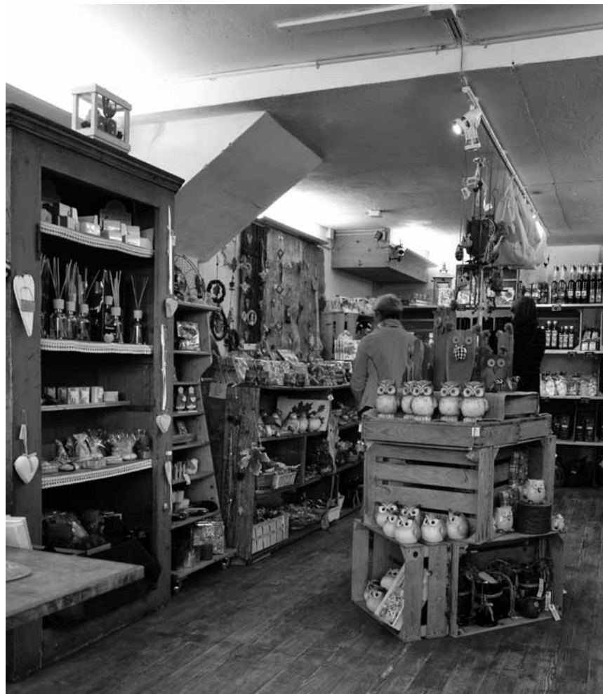
Vor allem in Deutschland bei Authentizitätsfetischisten immer sehr beliebt: Der „Hofladen“, in dem garantiert alles handgemacht und mit Liebe hergestellt worden ist.

Immerhin: Die Population der Spezies der Nacktschnecken ist durch die Mitarbeit meiner fünf Hühner wieder deutlich geschrumpft. Aber bei der aktuellen Regenmenge und demnächst wieder Wärme im Überfluss lassen die Schnecken sich nicht dreimal bitten, vermehren sich wie verrückt und schlürfen fressgierig über meine zarten, gerade keimenden Salatblätter. Also muss ich ran – und zwar manuell. Ich kann schlecht meine Hühner in die Beete schicken. Die würden zwar die Schnecken ratzfatz erledigen, den Salat als Kollateralschaden ihres Scharrens und Herumlauftens aber auch. Nun denn, ein Messer gehört zur Grundausstattung eines jeden Kleingärtners. Manchmal sammle ich die Schnecken ein und kredenze sie meinen Hühnern als