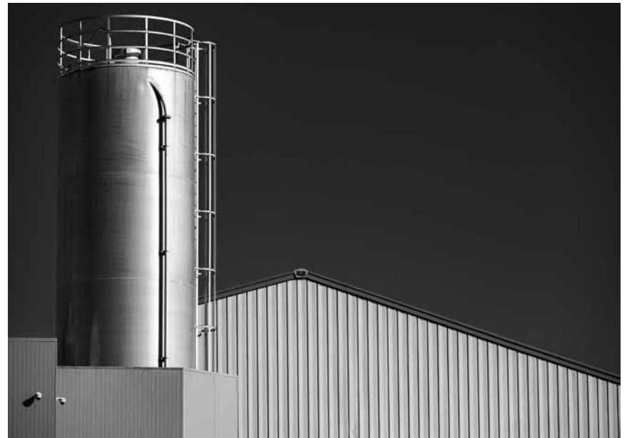
À la Millegalerie, des photographes proposent leurs « Regards sur Beckerich », jusqu'au 20 juin.