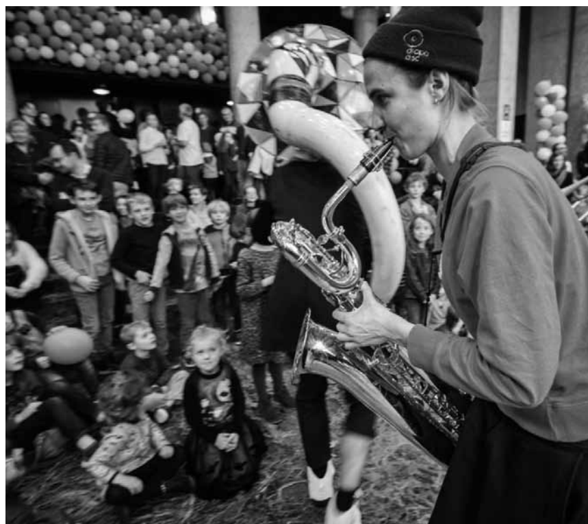
Le Big Bang ne marque pas seulement le début de l'univers - c'est aussi un festival de musique pour les jeunes à Neimënster ! « Big Bang Festival », les 3 et 4 juillet à partir de 14h.

Pol Belardi's Childhood Memories , Videospiel-Soundtracks, jardin de Wiltz, Wiltz , 20h30. www.festivalwiltz.lu Im Rahmen des Festival de Wiltz.