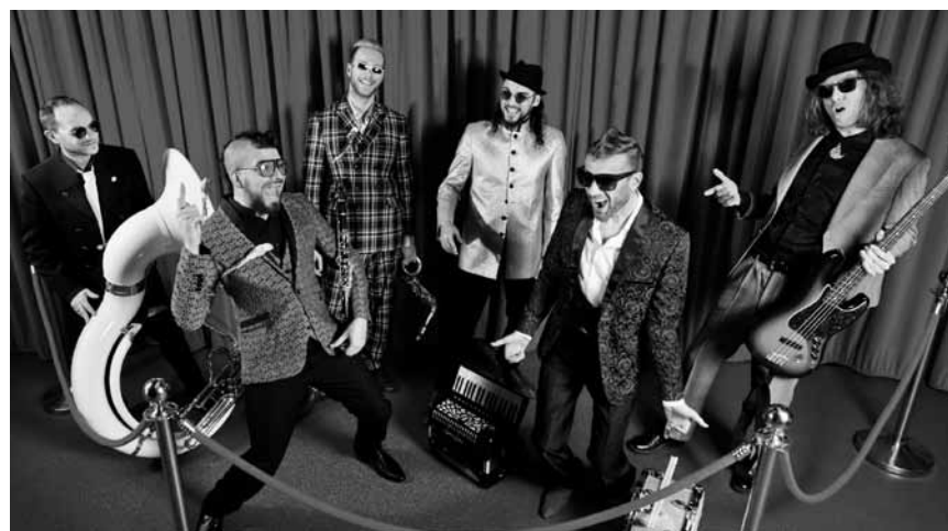
Au programme au jardin de Wiltz, ce samedi 26 juin à 15h et à 20h : le « happy powerful balkan folk » de la fanfare Couche-Tard.