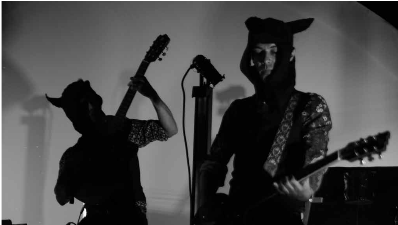
Les Ourk ne sont pas des créatures mythiques du pays des merveilles, mais un groupe de « rock tropicaliste » invité sur le parvis de Neimënster, le 11 juillet à 17h.