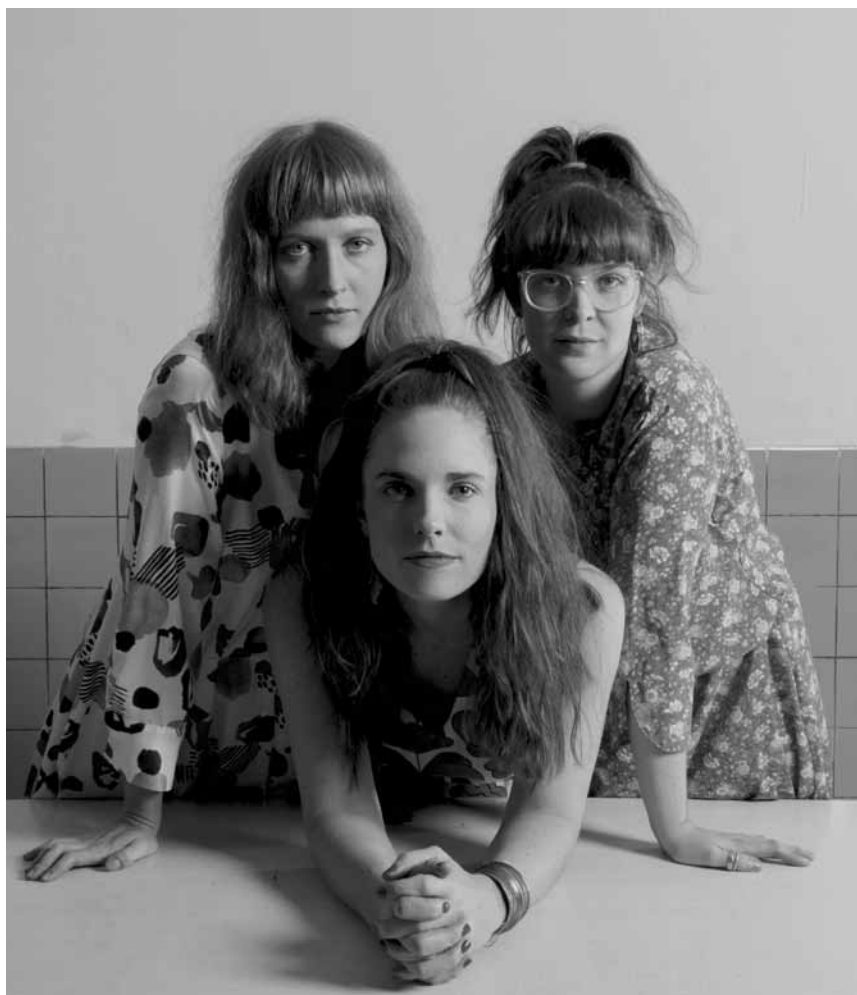
Köln ist zu Besuch im Innenhof der Tufa Trier: Die Frauenband Luah spielt dort am 9. Juli, um 19:30 Uhr. Jazz.