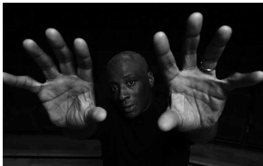
Le pianiste Wayne Marshall rendra hommage à Marc Chagall, avec l'Orchestre national de Metz, le 9 juillet à 20h à l'Arsenal.

The Quest , mise en scène de Cédric Eeckhout, Théâtre des Capucins, Luxembourg , 20h. Tél. 47 08 95-1. www.theatres.lu