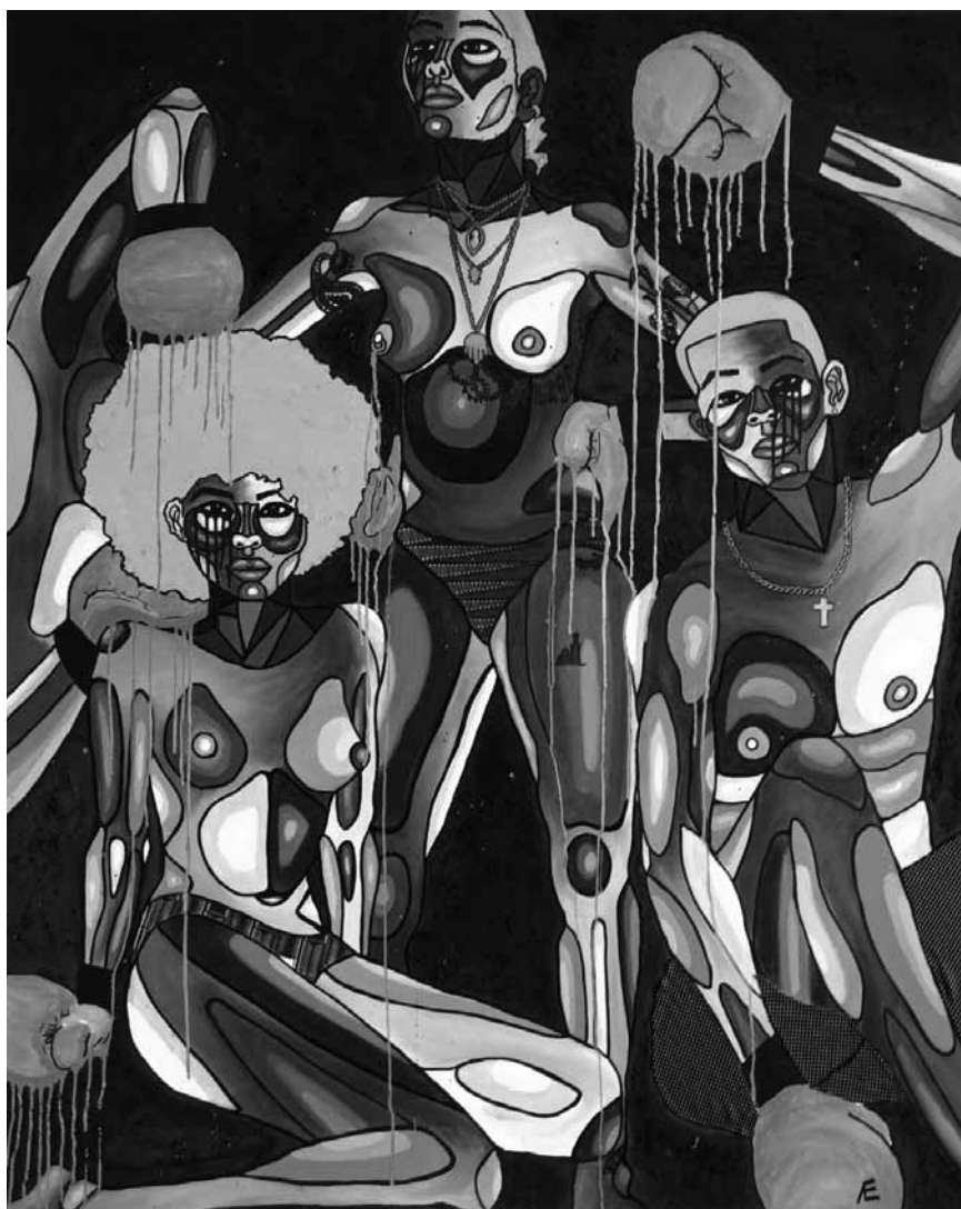
L'artiste franco-congolais Alexandre Elenga questionne l'expression « Man of Colour » et critique la société. Au Casino 2000, Ruth Gallery, jusqu'au 22 août.