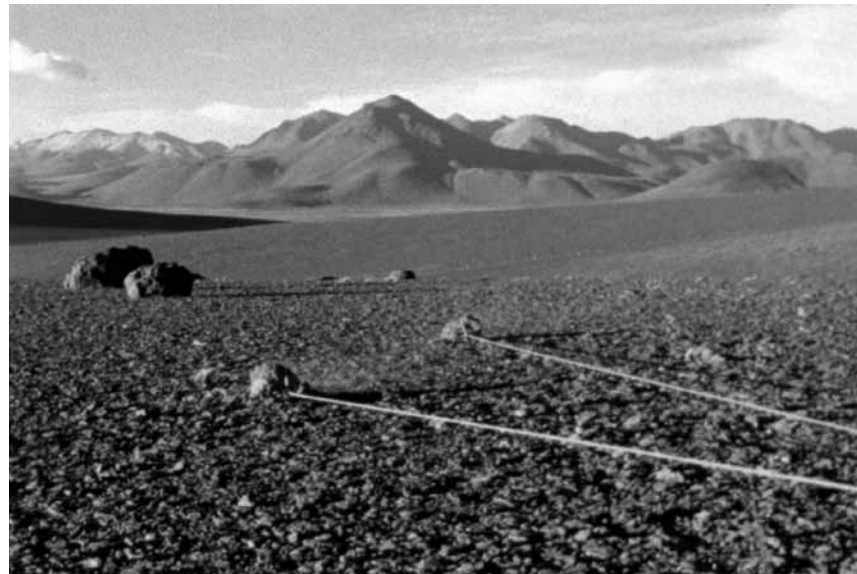
Le Mudam fouille dans sa collection et présente online des vidéos et films d'artistes sous le titre « You'll Find Your Peace With Me »

œuvres de la collection autour de la question de la représentation de l'humanité au début du 21e siècle, Musée d'art moderne Grand-Duc Jean (3, parc Dräi Eechelen. Tél. 45 37 85-1), jusqu'au 13.9, je. - lu. 10h - 18h, me. nocturne jusqu'à 21h.