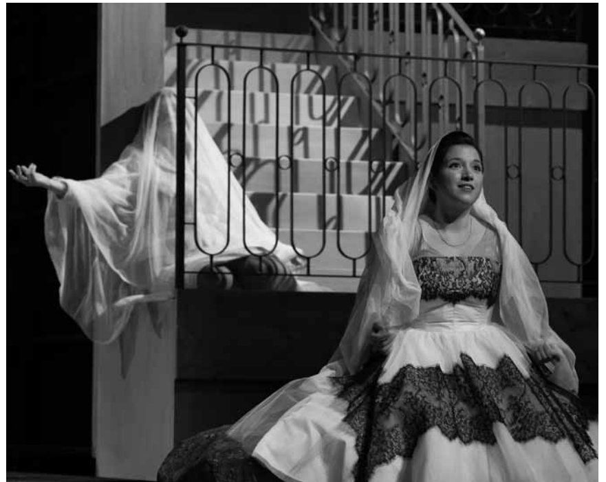
Er heiratet mal wieder: Die „Hochzeit des Figaro“, Mozarts Oper nach dem Libretto von Beaumarchais, kommt an diesem Samstag, dem 4. September, ins Theater Trier.