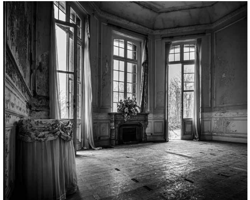
Sa passion photographique ? Les lieux abandonnés : dans « Urbex - ma vie de château », Anne Back explore des châteaux avec son appareil. À la maison de la culture d'Arlon, jusqu'au 10 octobre.