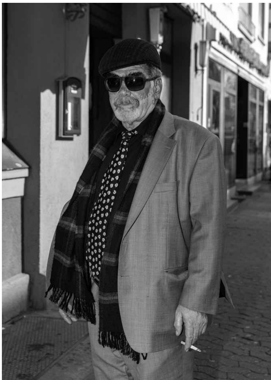
Lukas Ratius Fotografien von der Stadt Saarbrücken und ihren Einwohner*innen werden bis zum 17. Oktober im Rahmen des Ausstellungsprojekts „andersw(oh)er“ in den Schaufenstern einer ehemaligen Arztpraxis am Königsbruch 1 in Saarbrücken gezeigt.

Fotografie, Schaufenster der ehemaligen Arztpraxis am Königsbruch 1, bis zum 17.10., durchgehend.