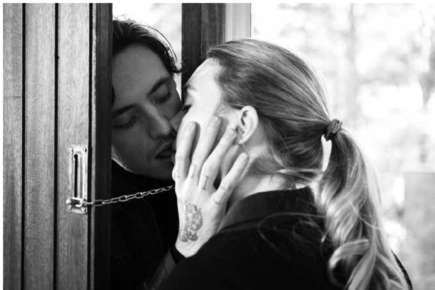
Danielle Arbid adapte le roman autobiographique et sulfureux d'Annie Ernaux : « Passion simple », nouveau à l'Utopia.