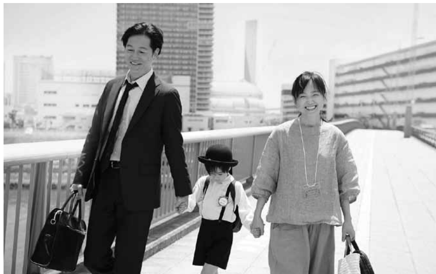
Die Filmemacherin Naomi Kawase stellt sich die Frage nach der Definition von Mutterschaft: „Asa ga kuru (True Mothers)“. Neu im Utopia.