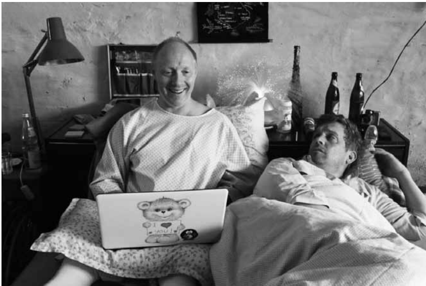
Der bayerische Dorfpolizist Eberhofer sitzt schon wieder in der Krise: „Kaiserschmarrndrama“. Neu im Kinopolis Belval und Kirchberg.