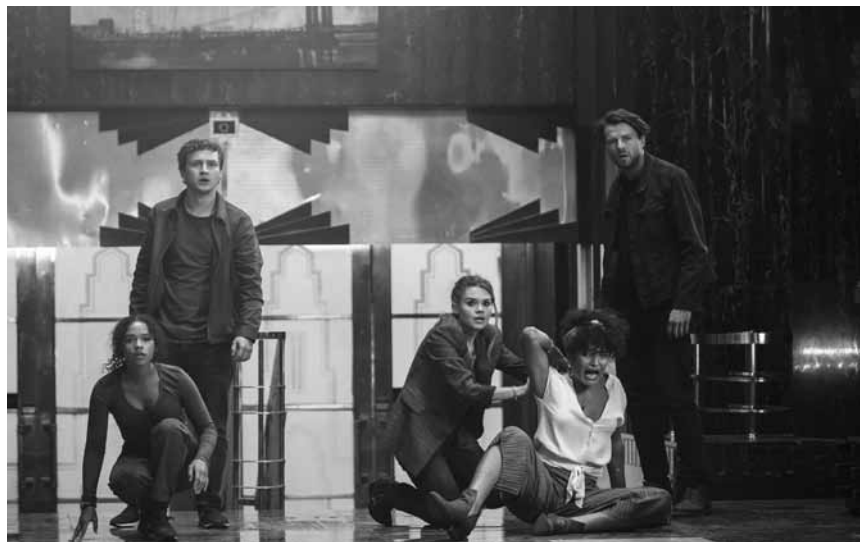
Das Horrorspiel geht weiter: „Escape Room: Tournament of Champions“. Neu im Kinepolis Belval und Kirchberg.

Es ist das Jahr 1020 als der Hexenmeister Catweazle vor den barbarischen Normannen fliehen muss. Mit dem Zauberspruch „Salmei, Dalmei, Adomei!“ will er sich auf und davon machen, doch das geht gehörig schief: Catweazle landet mitten im Deutschland der Gegenwart! Er trifft auf den 11-jährigen Förstersohn Benny, der Mitleid mit dem komischen Mann hat und ihn bei seinen Eltern versteckt. Die moderne Welt hält für den Zauberer und seine Kröte Kühlwälder einige Überraschungen bereit, von der Glühbirne über Toiletten bis hin zu Ampeln und Autos