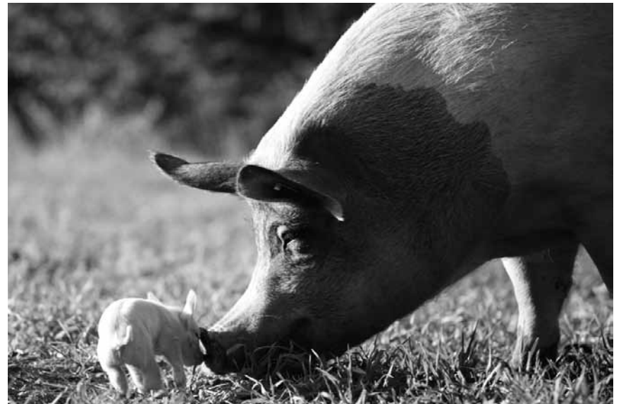
Victor Kossakovskys Doku zeigt den Alltag einer Sau und ihrer Ferkel und gewährt einen Einblick auf Augenhöhe in deren Wirklichkeit: „Gunda“, neu im Utopia.

Le film raconte l'enfance, l'âge adulte et la vieillesse de cinq sœurs nées et élevées dans un appartement au dernier étage d'un immeuble de la banlieue de Palerme. Une maison qui porte les signes du temps qui passe, comme ceux qui y ont grandi et ceux qui y vivent encore. L'histoire de cinq femmes, d'une famille, de celles qui partent, de celles qui restent et de celles qui résistent.