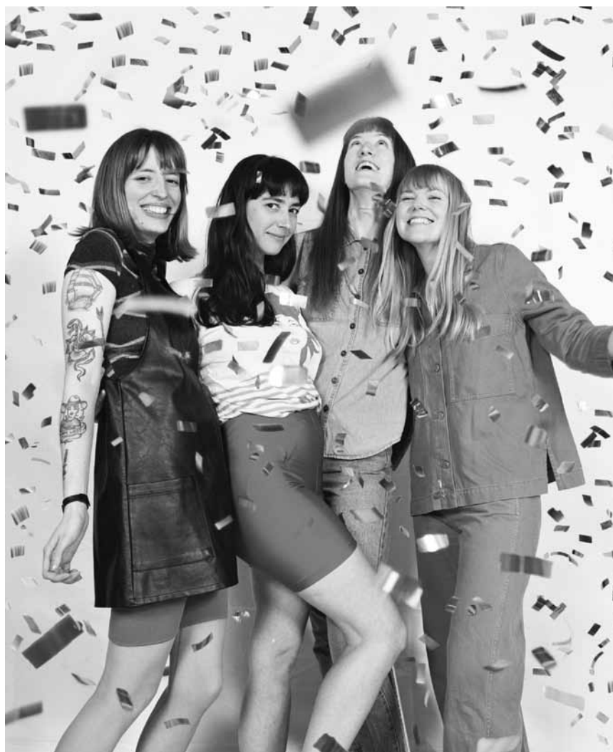
Los Bitchos zaubern am Mittwoch, dem 25. August um 20 Uhr in den Rotondes eine Mischung aus Latin, Cumbia und psychedelischem Pop.

Renc'Art - œuvre du mois : Foni Tissen (1909-1975), Dé Schwoarzen vua Veinen II , Musée national d'histoire et d'art, Luxembourg, 12h30 (L). Tél. 47 93 30-1. www.mnha.lu Inscription obligatoire : servicedespublics@mnha.etat.lu