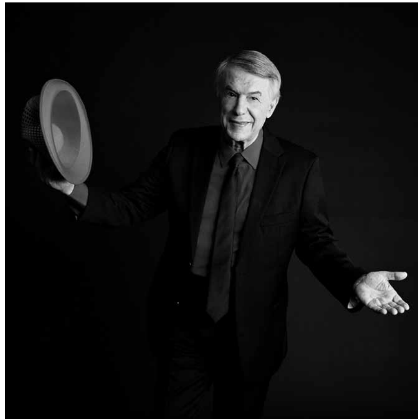
L'auteur-compositeur italo-belge Adamo se produit à la Philharmonie le 30 mai à 20h.

Les nuits rêvées d'un loup en hiver , présentation du livre du photographe Paulo Lobo, Camões - centre culturel portugais, Luxembourg, 19h. Tél. 46 33 71-1. www.instituto-camoes.pt