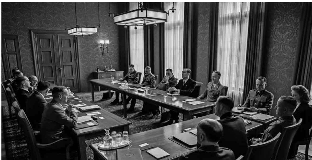
Die wohl mörderischste Konferenz in der Geschichte der Menschheit: „Die Wannsee-Konferenz – Die Dokumentation“ läuft neu im Utopia.