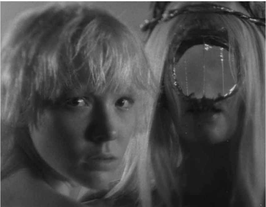
Le 1er juin à 20h, le Kinosch part vers une planète sauvage : dans « After Blue », il y a des meurtres, un paradis sale et une criminelle ensevelie sous le sable.

Nach den Ereignissen aus „Spider-Man: No Way Home“ muss Dr. Stephen Strange erkennen, dass sein Zauber nicht gewirkt hat und die Gefahren des Multiversums doch in seine Welt gelangt sind. Um mehr darüber zu erfahren, sucht er die Hexe Wanda Maximoff auf. Gemeinsam mit der Jugendlichen America Chavez, die durch Welten springen kann, begibt sich Strange auf eine gefährliche Reise durch die alternativen Realitäten des Multiversums. An der Seite neuer und alter magischer Verbündeter