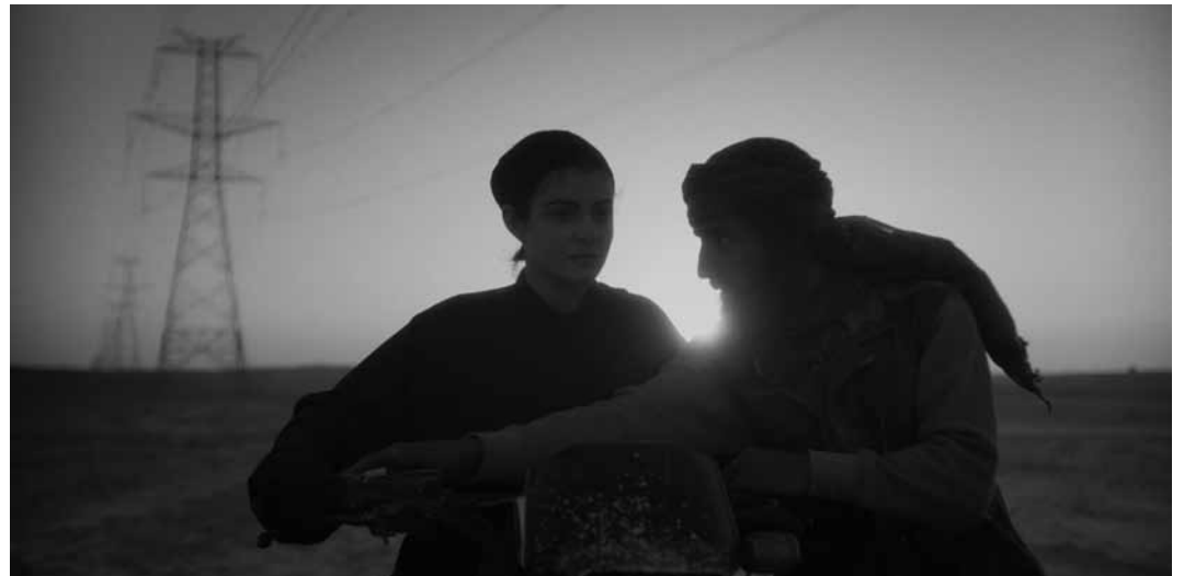
Dans « Rebel », d'Adil El Arbi et Bilall Fallah, deux frères sont confrontés aux recruteurs du djihad. À l'Utopia et au Kinopolis Kirchberg.

SRB 2022 von Hadzi-Aleksandar Durovic. Mit Milena Predic, Milica Stefanovic, Mariam Amer und Filip Hajdukovic. 73'. O.-Ton + Ut. Ab 6. Kinopolis Kirchberg, 9.10. um 16h45. Ein frommes Mädchen verlässt das Leben im sündigen Konstantinopel, um in der Wüste von Jordanien zu