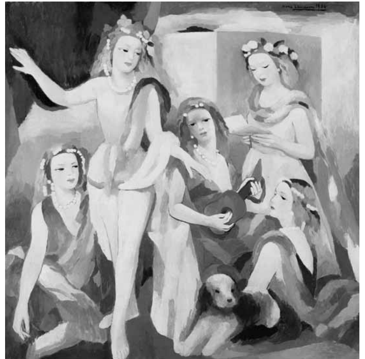
Le Centre Pompidou-Metz présente sa propre collection lors de l'exposition « La répétition. Œuvres phares du Centre Pompidou », du 4 février au 27 janvier 2025.

Neimënster (28, rue Munster, L-2160 Luxembourg), bis zum 24. Februar, Mo. – So. 10h – 18h. Am 31. Januar ist die Ausstellung ausnahmsweise ab 15h geschlossen und ab dem 1. Februar in der Salle Lou Koster (2. Etage der Abtei) zu sehen.