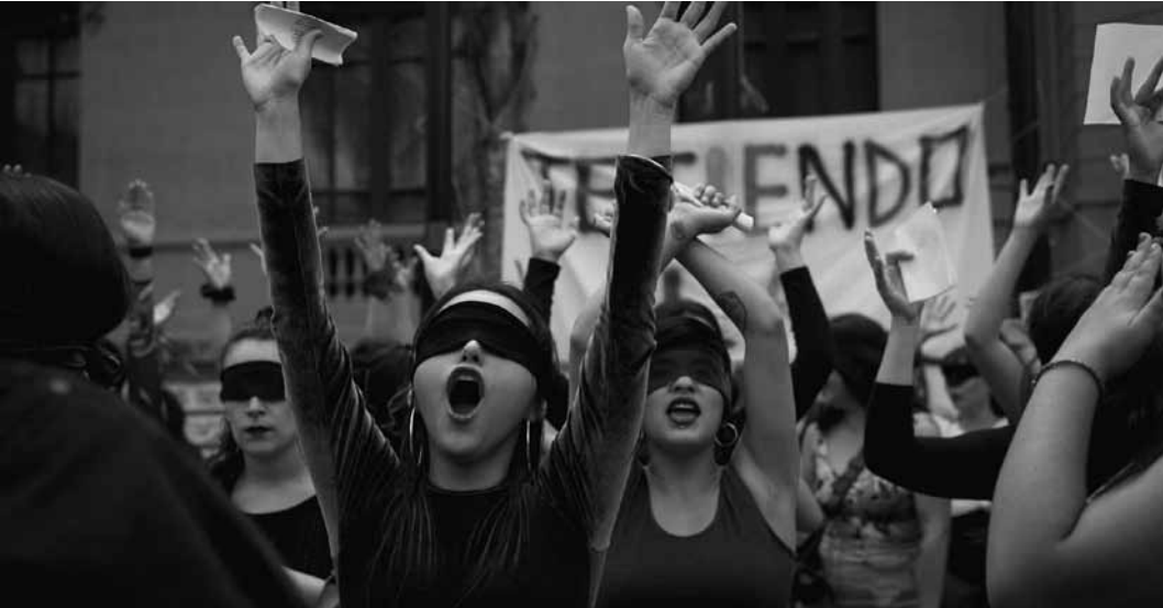
« Mi país imaginario » est un documentaire de Patricio Guzmán sur la révolution chilienne de 2019 – à voir ce samedi 28 janvier à 17h à l'Utopia.

hung hinein. Aber dann schlägt die Liebe doch zu.