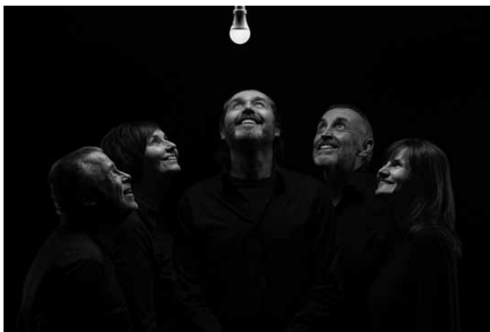
Die Stinktiere machen am 4. Februar, um 20 Uhr Halt im Zolwer Artikuss wenn es heißt: „De Leschte mécht d'Luucht aus“, mit dem Kabaret Sténkdéier.

Tosca , unter der Leitung von Jochem Hochstenbach, inszeniert von