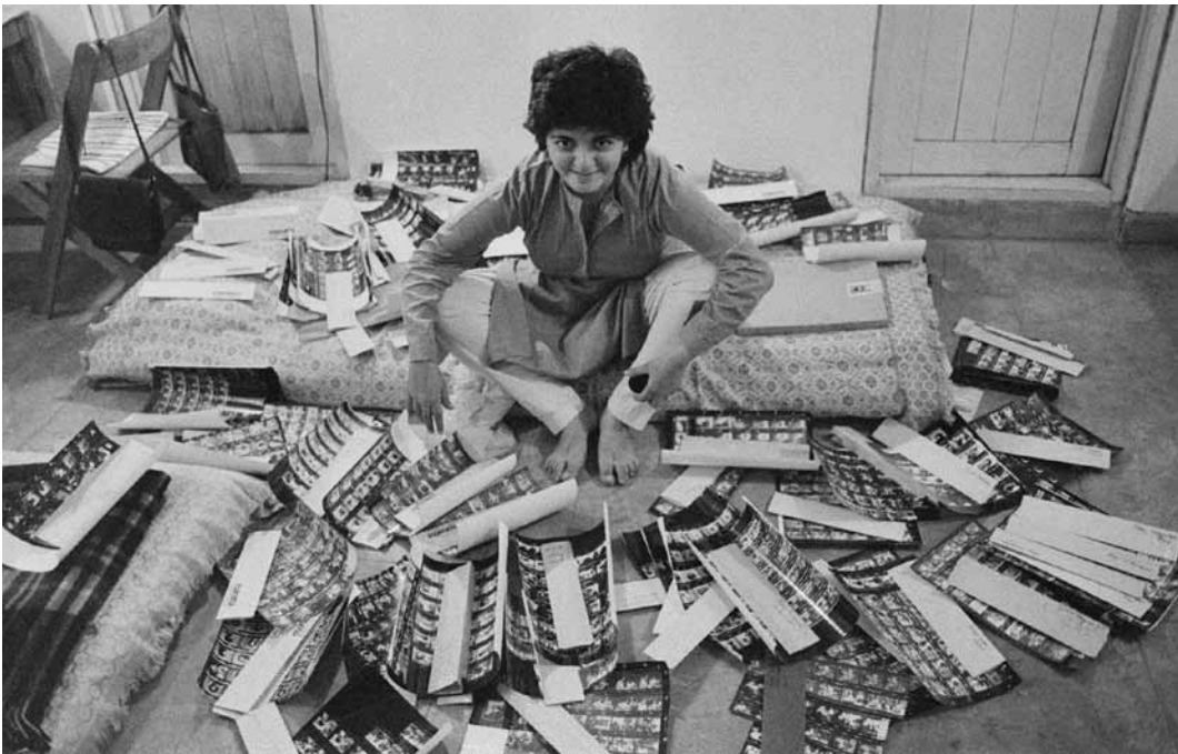
Im Rahmen des „European Month of Photography Luxembourg“ lässt die indische Künstlerin Dayanita Singh in „Dancing with My Camera“ ihr gesamtes Werk Revue passieren. Die Ausstellung ist bis zum 10. September im Mudam zu sehen.

Jours fériés 10h - 18h. Luxembourg Museum Days : entrée gratuite les sa. 20.5 et di. 21.5. Dans le cadre de l'« European Month of Photography ».