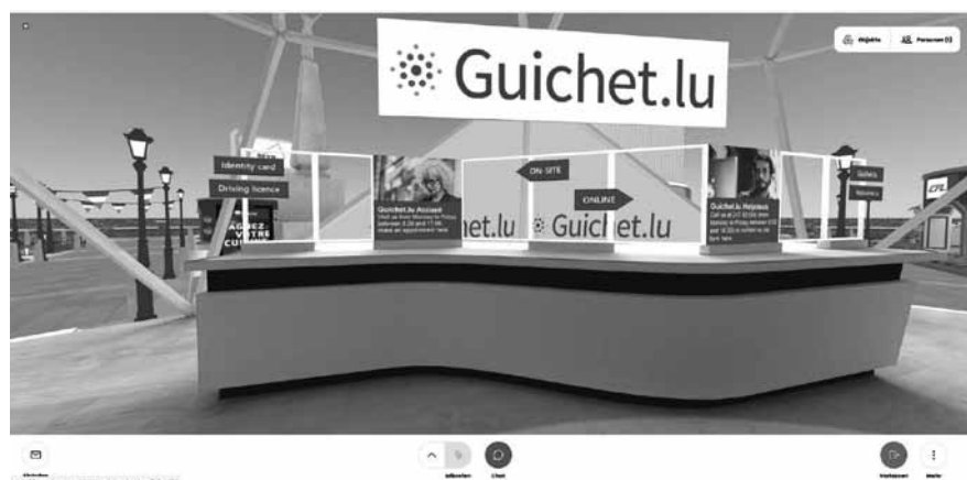
Am virtuellen Guichet.lu-Schalter lässt dich kein Ausweis bestellen, sondern lediglich eine Website öffnen.

Andere sind da günstiger weggekommen, so zum Beispiel „Luxinnovation“, die parastaatl. „Innovationsagentur“. Ihr Pavillon im Megaverse sei kostenlos gewesen, die Präsenz sei