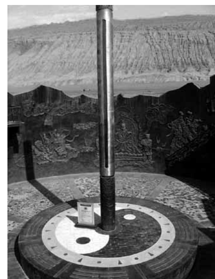
Tourismusattraktion Thermometer (Turpan-Senke).

Konkret dürfte der OPC-Vorschlag einer CO 2 -Steuer von 200 Euro pro Tonne (46 Cent pro Liter Benzin) für Aufmerk-