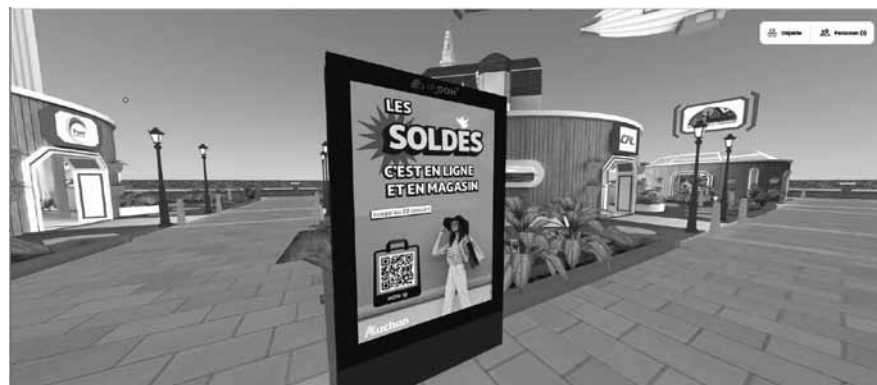
Wer wollte nicht immer schon eine VR-Brille aufsetzen, um sich flache Werbeplakate anzusehen?