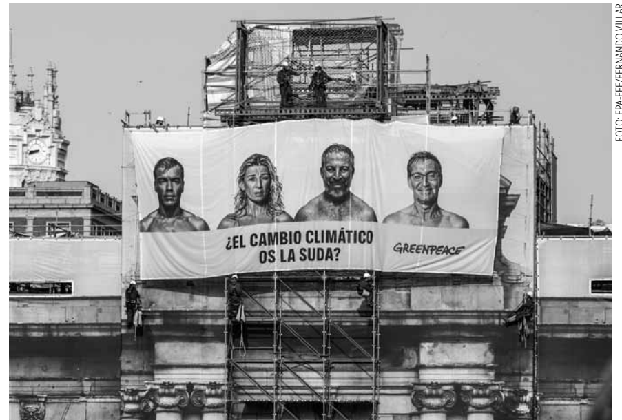
„Ist ihnen der Klimawandel egal?“, fragte Greenpeace auf einem großen Banner in Madrid. Zu sehen sind, von links nach rechts, die Spitzenkandidat*innen Pedro Sanchez (PSOE), Yolanda Díaz (Sumar), Santiago Abascal (Vox) und Alberto Nunez Feijoo (PP).

Nach den Regionalwahlen vom 28. Mai, bei denen PP und Vox Mehrheiten in zahlreichen Regionen und Kommunen gewonnen haben, gibt es auch dort Rückschritte im Kampf gegen den Klimawandel. Beispielsweise auf den Balearen: Am 3. Juli wurde bekannt, dass die neue Regionalregierung unter Marga Prohens vom PP auch hier das Umweltschutzministeri-