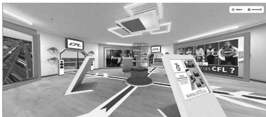
In ihrem Megaverse-Pavillon sucht die CFL neue Mitarbeiter*innen.