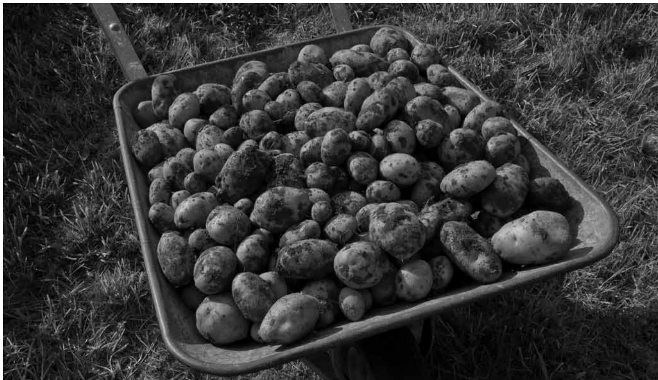
Festkochend, gelbfleischig, gut: Die Kartoffelsorte Linda.

Und was soll ich sagen: Alle Pflanzkartoffeln der Sorte Linda sind aufgegangen, wenn auch einige wenige etwas später. Es gab keinen Ausfall. Auf Linda ist Verlass, alle Pflanzen stehen perfekt im Kraut. Und was mich