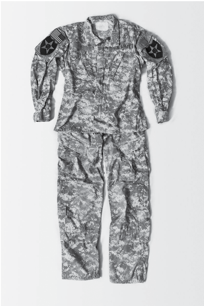
Dans son expo « On Rape – histoire de la misogynie, chapitre deux », à Neimënster du 14 juillet au 24 septembre, Laia Abril parle de la violence contre les femmes.

Ingeborg Knigge: Have You Done Your Duty Fotografien, KuBa - Kulturzentrum am EuroBahnhof e.V. (Europaallee 25), bis zum 9.7., Fr. 10h - 16h, So. 14h - 18h.