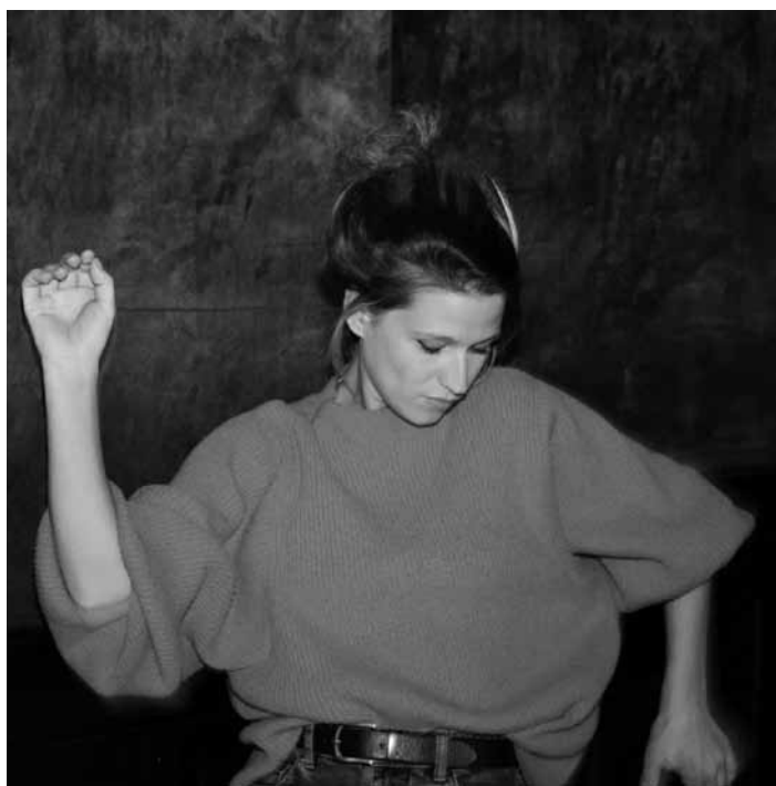
La chanteuse Selah Sue enchantera les aficionados avec son étonnante voix dans le cadre du festival de Wiltz, le 14 juillet à 20h30 dans l'amphithéâtre.