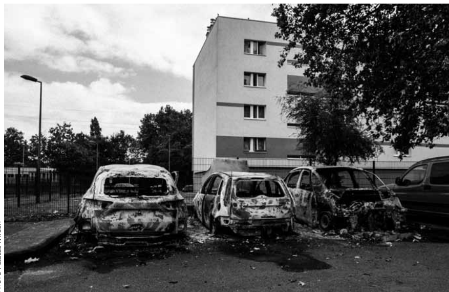
Des voitures calcinées à Uckange, après une nuit d'émeutes.

Contrairement à ce qu'affirment Marine Le Pen et consorts, les banlieues ne sont pas « des territoires perdus de la République », mais bel et bien des territoires abandonnés.