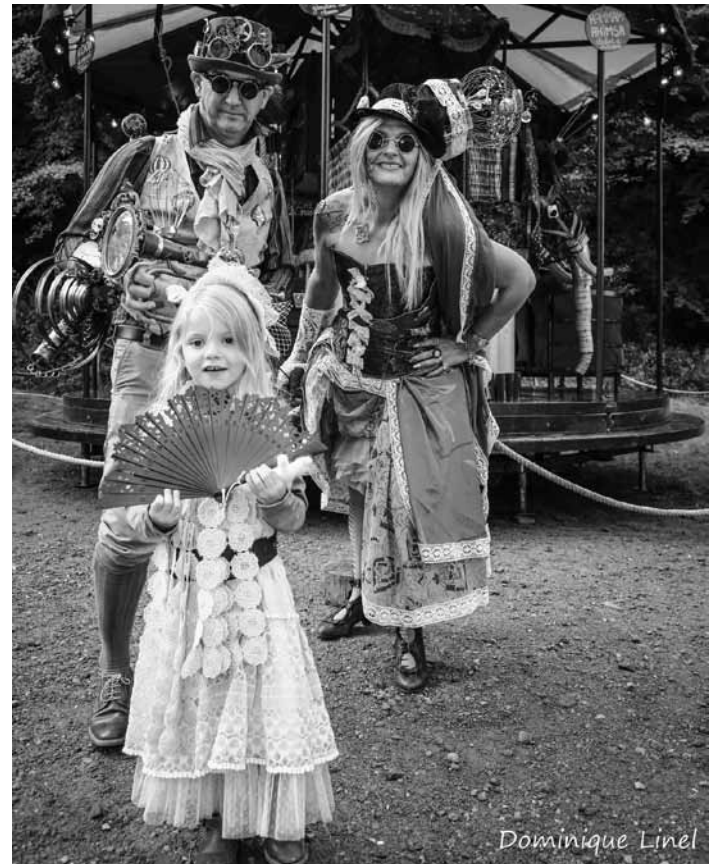
Zeitreise am Bahnhof in Lasauvage: An diesem Samstag und Sonntag findet die Steampunk Convention Anno 1900 statt, jeweils von 11 bis 18 Uhr.