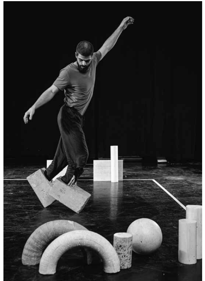
Ce weekend, il y aura du cirque-théâtre pour toute la famille par la compagnie Grensgeval aux Rotondes : « Korrol », ce samedi 14 octobre à 15h et 17h ainsi que ce dimanche 15 octobre à 11h et 15h.

Le cri des insectes , avec la cie Ne dites pas non, vous avez souri