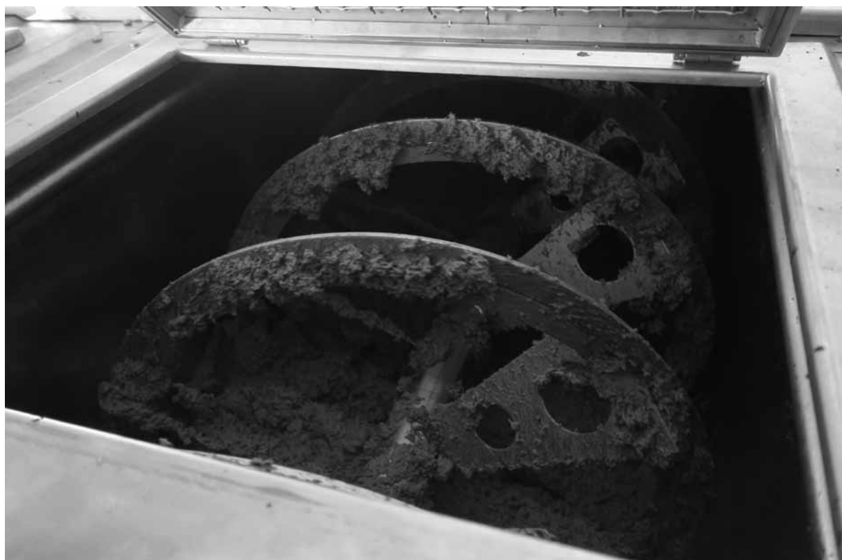
Im Mahlwerk: Auf mehr als unter 27 Grad Celsius darf sich das Olivenöl beim Pressvorgang nicht erwärmen.

bei 47, 48 Grad Hitze die Früchte fallen. Derart hohe Temperaturen über mehrere Wochen ohne Niederschlag machen selbst unsere widerstandsfähigen Olivenbäume nicht mit“, meint er und zieht eine Grimasse. Mit dieser Einschätzung ist er nicht allein. Der Ertrag ist in der ganzen Region stark rückläufig. „Nicht überall so stark wie rund um mein Dorf Charakopio, aber die Tatsache, dass unsere Olivenmühle erst am Nachmittag öffnet, spricht Bände“, sagt er.