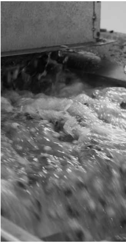
Mehrstufige Verarbeitung: Vor dem Mahlen werden die Oliven unter anderem gewaschen.