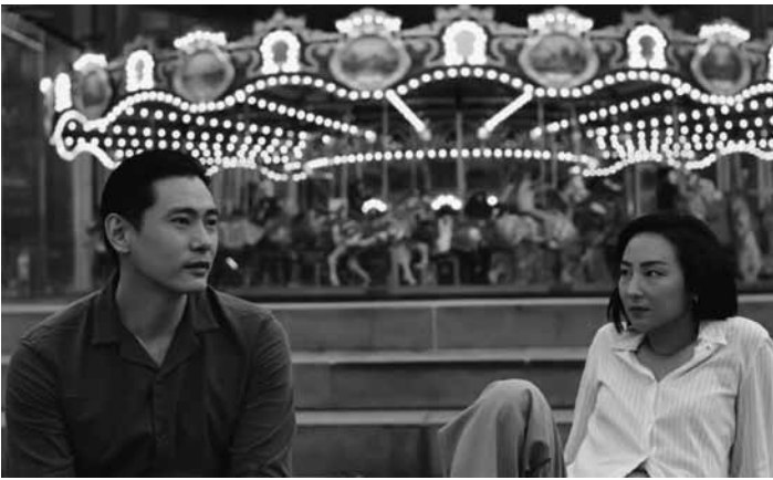
Zwei Freund*innen aus Kindertagen treffen nach Jahren der Online-Kommunikation wieder am gleichen Ort zusammen: „Past Lives“ von Celine Song, neu im Utopia.

Salaar: Ceasefire IND 2023 von Prashanth Neel. Mit Prabhas Raju, Prithviraj Sukumaran und Shruti Haasan. 175'. O.-Ton + Ut. Ab 16. Kinopolis Belval, 24.12. um 16h15. Ein Bandenführer versucht ein Versprechen einzulösen, das er seinem sterbenden Freund gegeben hat. Dafür muss er es jedoch mit anderen kriminellen Banden aufnehmen.