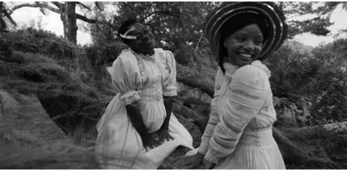
Ein Film über das Leben Schwarzer Frauen in den USA, Anfang 1900: „The Colour Purple“, neu im Kinopolis Kirchberg und in den regionalen Kinos.

D'Lëtzebuerger Sprooch(en) centre culturel Aalt Stadhaus (38, av. Charlotte. Tél. 5 87 71-19 00), bis de 27.1., Fr. + Sa. 10h - 18h.