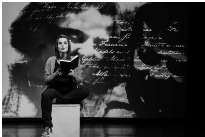
Sophie Scholls Leben als Multimediaperformance: am 13. März ab 18 Uhr in der Tufa Trier.

10000 gestes , chorégraphie de Boris Charmatz, Grand Théâtre,