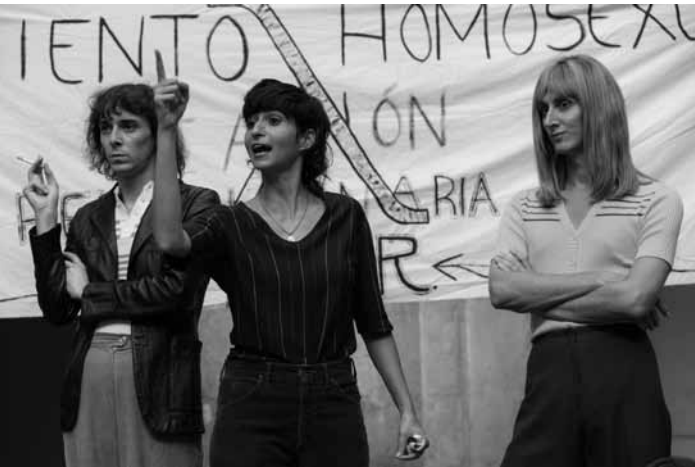
« Te estoy amando localmente » : un drame historique qui débute en 1977 à Séville, où l'homosexualité est à cette époque considérée comme une offense criminelle – à voir le 17 mars à 17h30 à la Cinémathèque.

Boléro F/B 2024 d'Anne Fontaine. Avec Raphaël Personnaz, Doria Tillier et Jeanne Balibar. 120'. V.o. À partir de 12 ans. Utopia En 1928, alors que Paris vit au rythme des années folles, la danseuse Ida Rubinstein commande à Maurice Ravel la musique de son prochain ballet. Tétanisé et en panne d'inspiration, le compositeur feuillette les pages de sa vie - les échecs de ses débuts, la fracture de la Grande Guerre, l'amour impossible qu'il éprouve pour sa muse