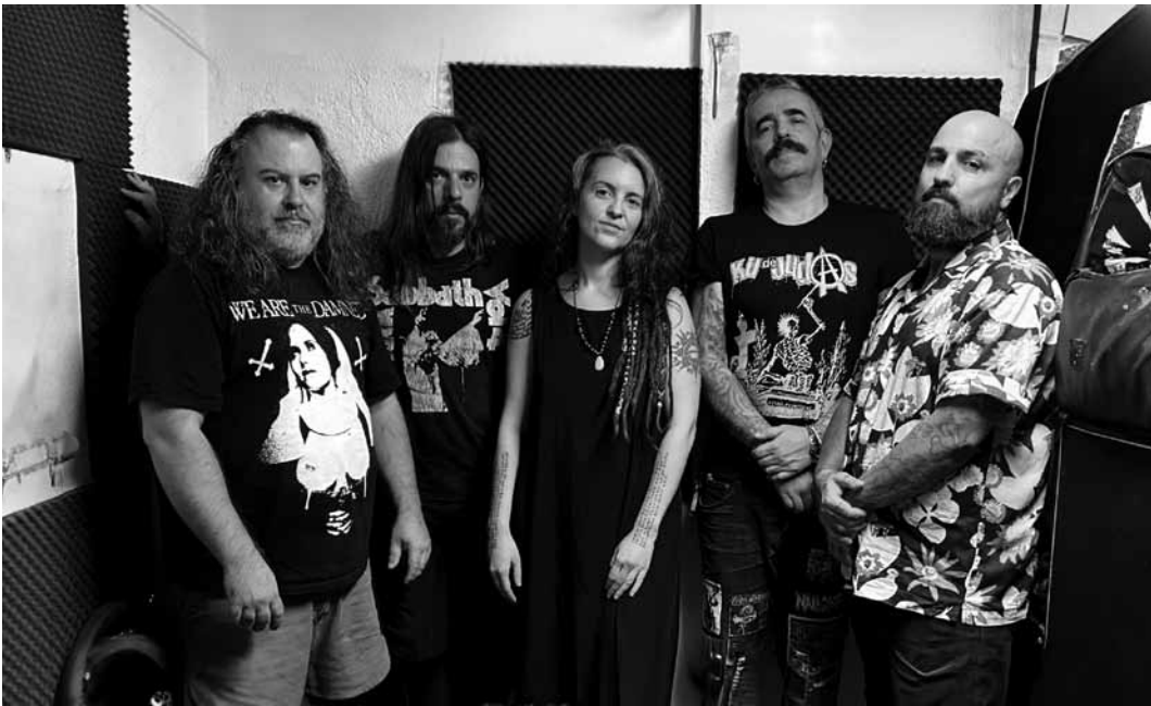
Du rock au Aalt Stadhaus à Differdange : le groupe Sinistro présente sa musique le 16 mars à partir de 20h.