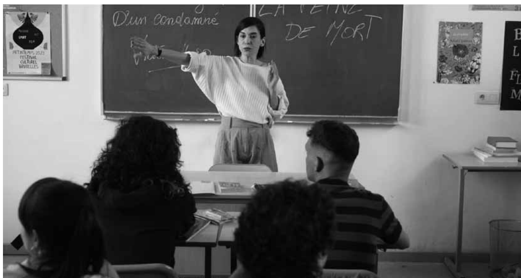
Nouveau à l'Utopia : « Amal », ou l'histoire d'une enseignante motivée, mais menacée pour ses méthodologies pédagogiques.

Bereits im Jahr 2005 erkennt der Hedgefondsmanager Michael Burry, dass die Welt auf eine Finanzkrise zusteuert. Bei den Banken findet er mit seinen Prognosen jedoch kein Gehör. Daraufhin fasst er einen perfiden Plan: Gemeinsam mit anderen risikofreudigen Spekulanten, wie dem Trader Mark Baum, dem Banker Jared Vennett und dem