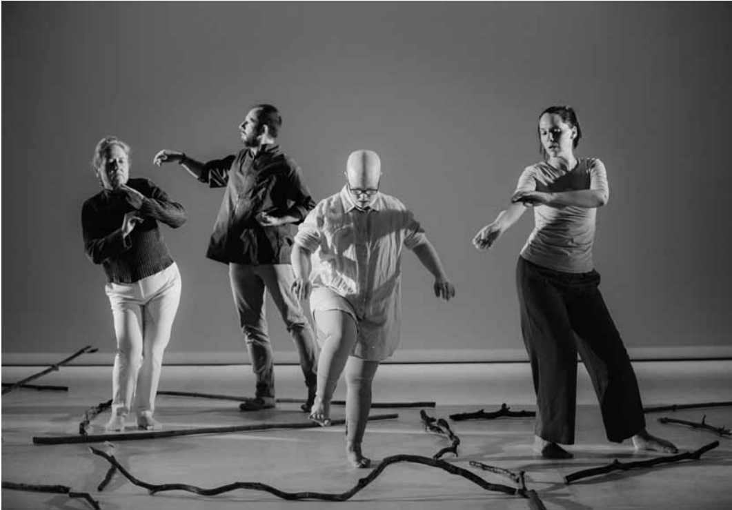
Tanz und Inklusion : In „Re V Ivre – Erwachen/Leicht zu Lesen“ von Annick Pütz und Giovanni Zazzera treffen auf der Bühne Menschen mit und ohne Behinderung aufeinander – am 22. und am 23. März jeweils um 20 Uhr sowie am 24. März um 17 Uhr im Mierscher Kulturhaus.

Alle Rezensionen zu laufenden Ausstellungen unter/Toutes les critiques du woxx à propos des expositions en cours : woxx.lu/expoaktuell