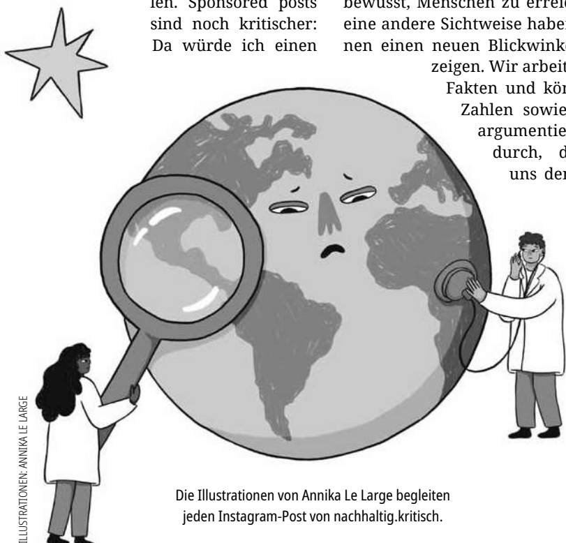
ILLUSTRATIONEN: ANNIKA LE LARGE

Die Artikel, Podcasts und den Link zum Instagram-Kanal von nachhaltig.kritisch findet sich unter nachhaltigkritisch.de . Das Buch „Miese Krise“ (22 Euro) ist im Katapult Verlag erschienen.