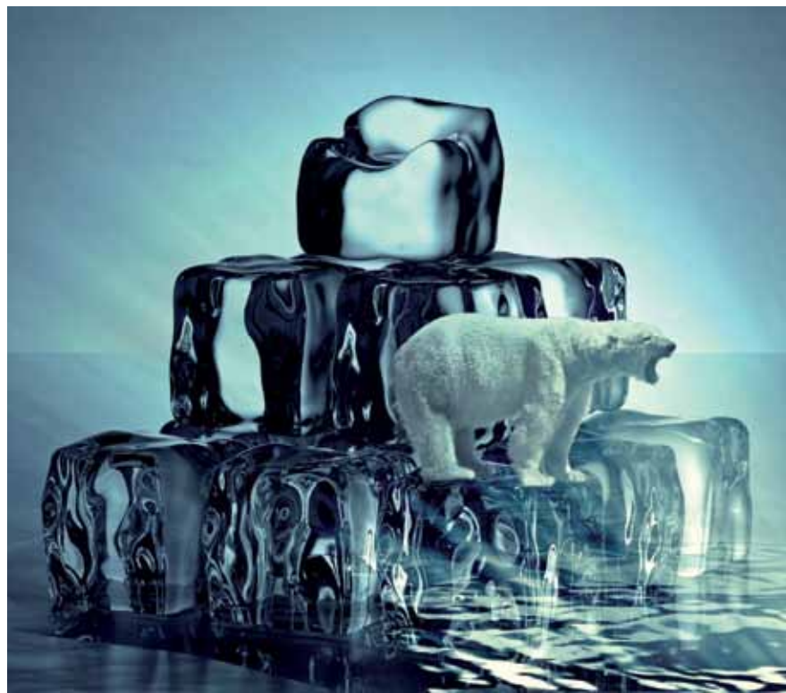
Wie können sich Eisbären an die Erderwärmung anpassen? Mit Eiswürfeln natürlich!

klar, inwiefern eine „grünere und resilientere Ökonomie“ einschneidende Veränderungen beinhaltet, soll sie doch auch eine Gesellschaft schaffen, die „sicherer und wohlhabender [ist] und grünes und soziales Unternehmertum und Innovation begünstigt“. Formulierungen wie diese erinnern stark an das Win-win-Programm, das dem European Green Deal zugrunde liegt. Der mittlerweile von rechten Parteien infrage gestellte Green Deal kommt mehrfach in der Déclaration vor – der Text ist deutlich stärker auf den Erhalt der klimapolitischen Top-down-Errungenschaften der vergangenen fünf Jahre ausgerichtet als auf das Einfordern dessen, was die sich radikalisierende Klimabewegung für notwendig erachtet.