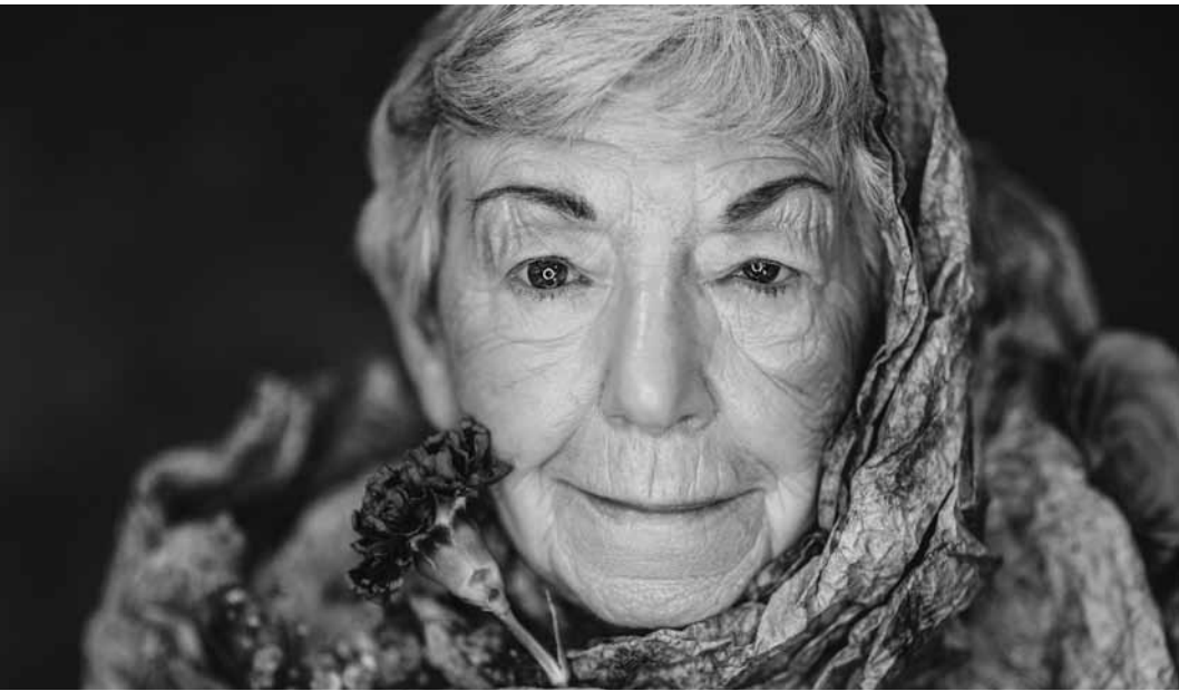
« La dignité des femmes vieillissantes » : photographies faites par Tanja El Kabid et à voir au Centre culturel Aalt Stadhaus à Differdange, du 5 jusqu'au 16 mars.

Blick hinter den Vorhang, Theaterführung, Saarländisches Staatstheater, Saarbrücken (D) , 9h30. Tél. 0049 681 30 92-0. www.staatstheater.saarland