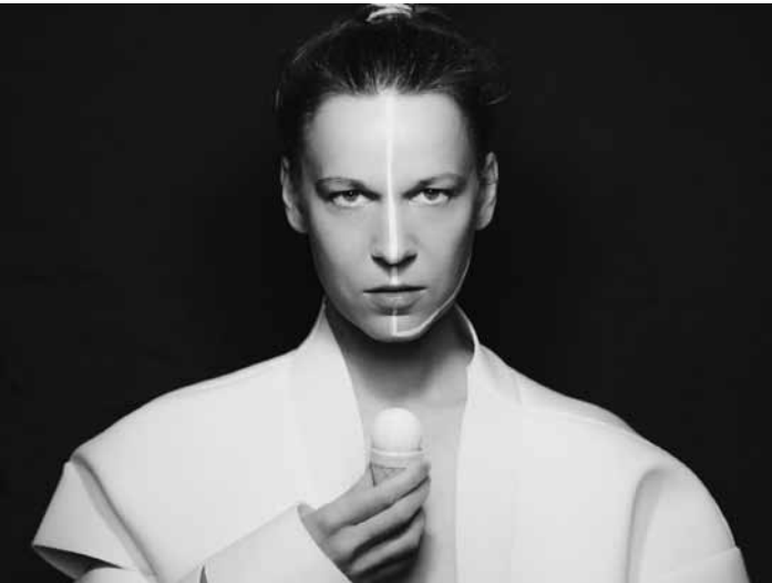
Du jazz au Neimënster : Kid be Kid, le 5 mars à 20h à Luxembourg-ville.