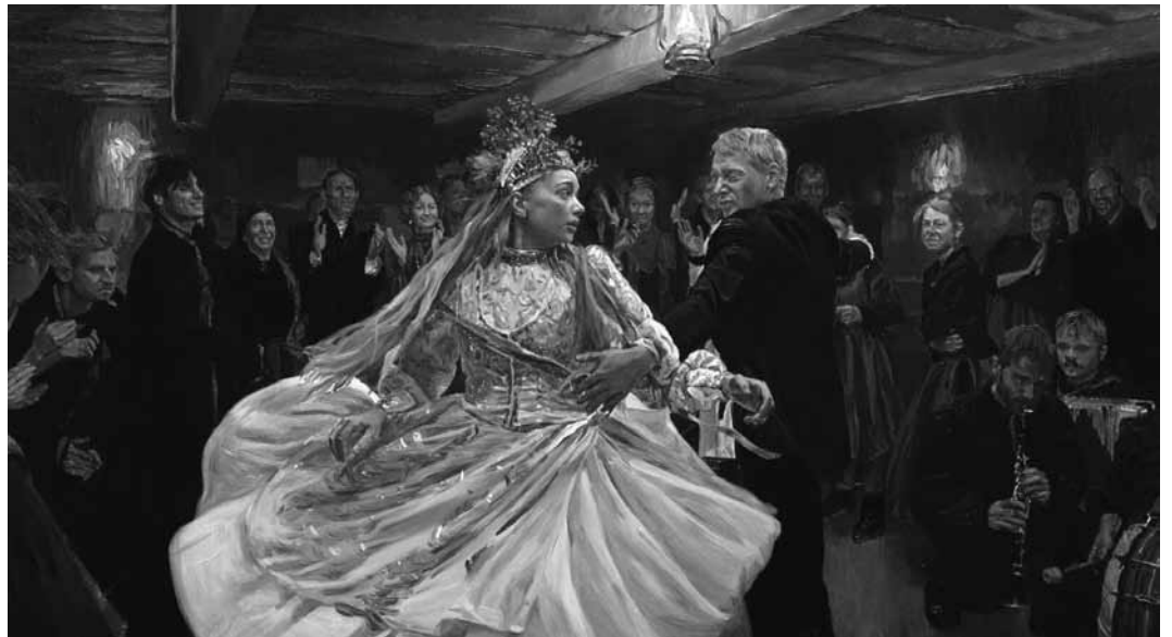
Neu im Utopia: „The Peasants“, die Geschichte eines zwangsverheirateten Bauernmädchens.

Nomades Nénètes de Sibérie, Mongols et Kazakhs d'Asie centrale, Zanskarpas de l'Himalaya, tous vivent dans des conditions difficiles et parfois extrêmes. Jacques Ducoin nous emmène à leur rencontre et témoigne