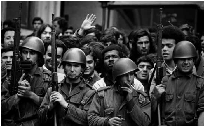
L'exposition « La révolution de 1974 : Des rues de Lisbonne au Luxembourg », présentée à partir du 26 avril au Nationalmuseum um Fëschmaart, offre une immersion captivante dans l'histoire commune entre le Luxembourg et le Portugal.

Lang (gare Dudelange-Ville). Tél. 51 61 21-292, du 27.4 au 16.6, me. - di. 15h - 19h. Vernissage le sa. 27.4 à 11h30.