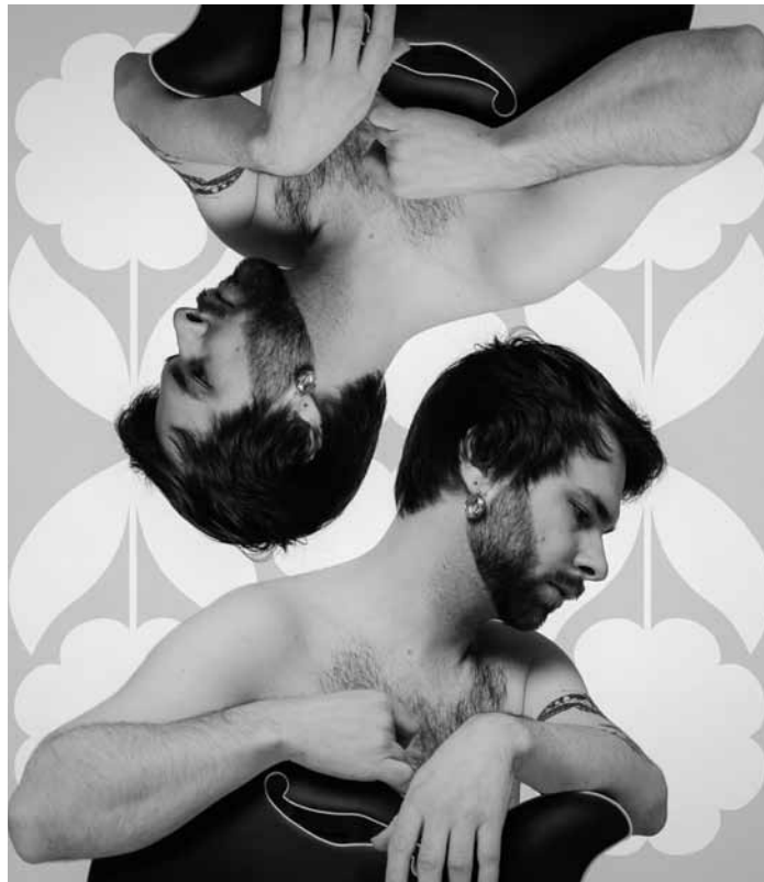
Energiegeladener Alternative-Rock: die luxemburgische Gruppe Boy From Home präsentiert am 26. April um 20 Uhr ihr neues Album im De Gudde Wëllen.

The End, My Friend. Wer hat meinen Hamster umgebracht? (hoffentlich ich) , von und inszeniert von Rebekka David, Alte Feuerwache, Saarbrücken (D) , 19h30. Tél. 0049 681 30 92-486. www.staatstheater.saarland