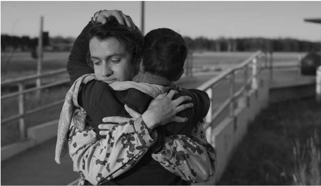
„Dis-placed“: Zwölf Künstler*innen zeigen ab Samstag, dem 6. Juli in der Kenschthal in Esch Werke zum Thema des Verlusts der Heimat und hinterfragen Identität sowie Zugehörigkeit.

Etienne Duval : 7 h - 22 h installation, Cecil's Box (4e vitrine du Cercle Cité, rue du Curé), jusqu'au 15.9, en permanence.