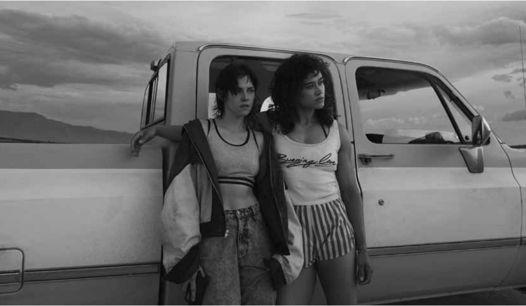
Im New Mexiko der 1980er-Jahre trifft Jackie, eine aufstrebende Bodybuilderin, auf Lou, deren Familie in dunkle Machenschaften verwickelt ist: „Love Lies Bleed“, neu in fast allen Sälen.