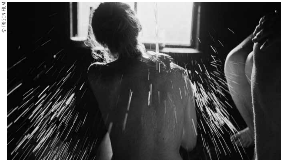
In „Smoke Sauna Sisterhood“ sieht man oft nur Körperfragmente, selten Gesichter.