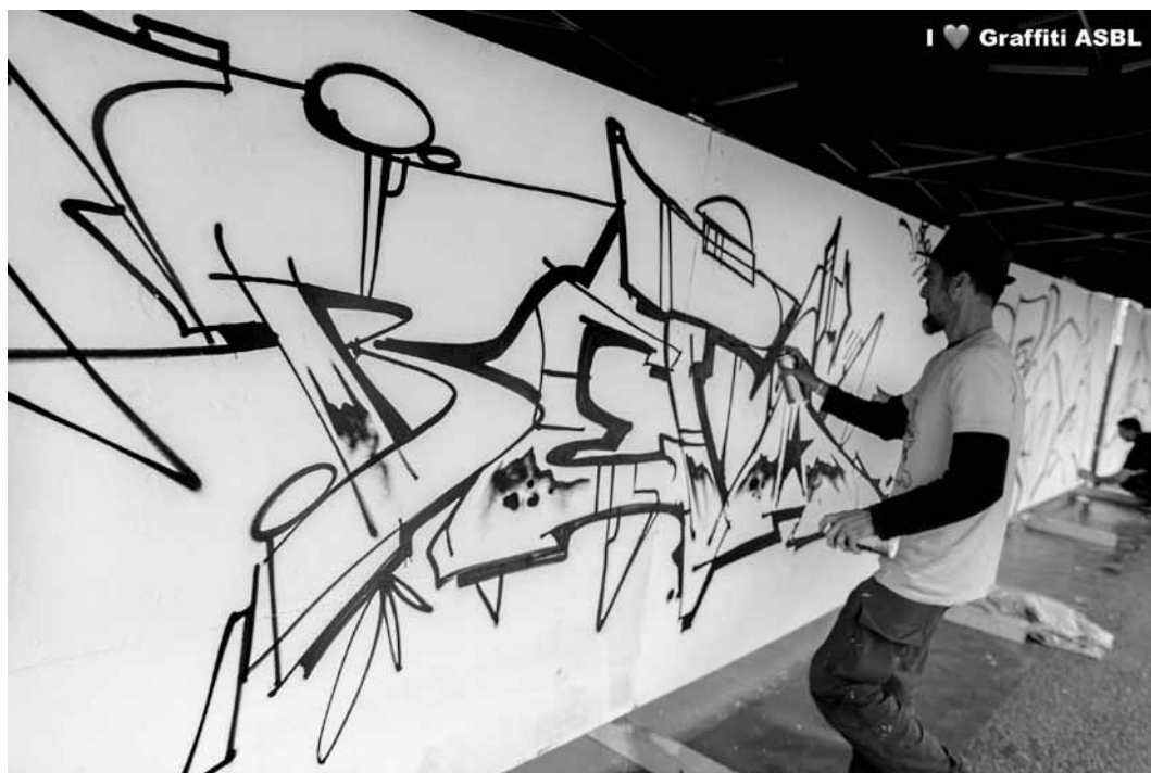
Ce samedi 29 juin à partir de 14h aux Rotondes : Graffiti Can't Fail. 24 artistes en compétition devant un jury international.

Poetry Slam , moderiert von David Friedrich, Kulturhaus Niederanven, Niederanven , 19h30. Tél. 26 34 73-1. www.khn.lu