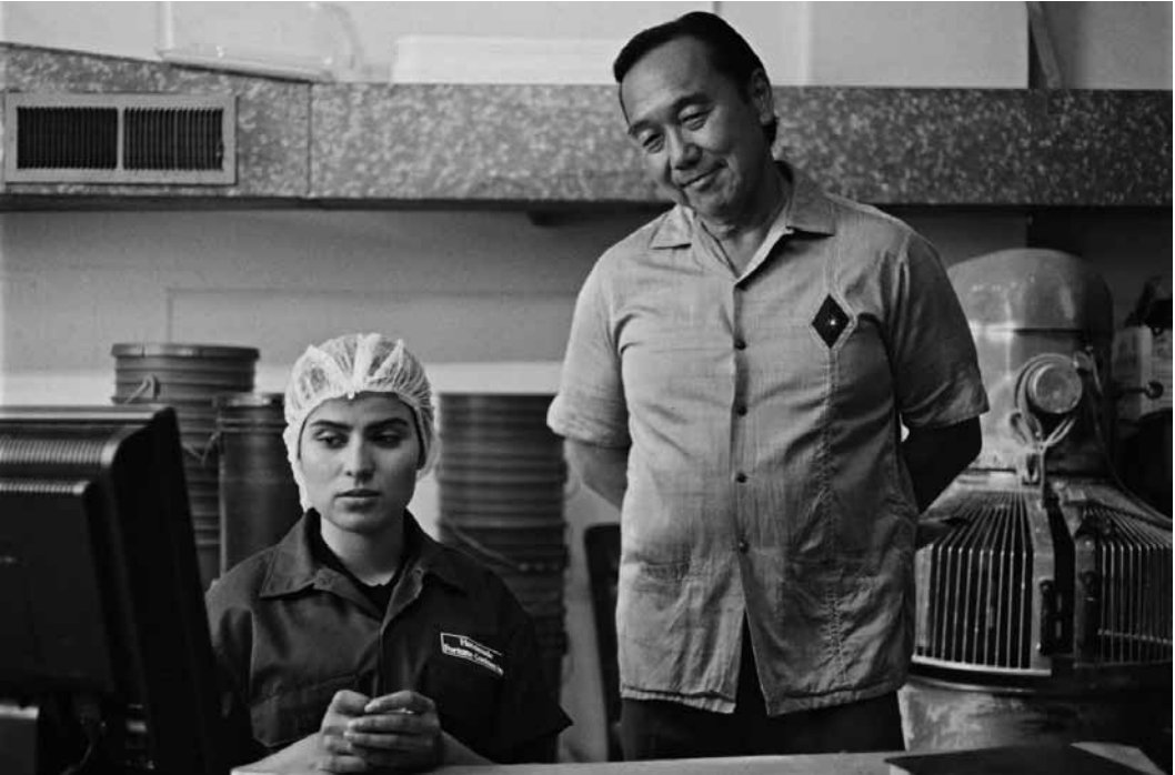
Donya, eine afghanische Übersetzerin, lebt jetzt in Kalifornien. Sie schreibt Weisheiten für Glückskekse und träumt von einem neuen Leben: „Fremont“ – Neu im Kinoler, Kulturhuef Kino, Orion, Prabbeli, Scala, Starlight, Sura und Utopia.

Fremont USA 2023 von Babak Jalali. Mit Anaita Wali Zada, Hilda Schmelling und Avis See-tho. 91'. O.-Ton + Ut. Ab 6. Kinoler, Kulturhuef Kino, Orion, Prabbeli, Scala, Starlight, Sura, Utopia Donya, eine ehemalige Übersetzerin für die amerikanischen Streitkräfte in Afghanistan, versucht ein neues Leben in San Francisco anzufangen. Doch obwohl sie einen Platz bei einer chinesischen Glückskeks-Fabrik gefunden hat, ist sie mit ihrem Alltag nicht zufrieden. Auf der Suche nach einer Lösung hat sie einen plötzlichen Moment der Klarheit und sendet in ei-