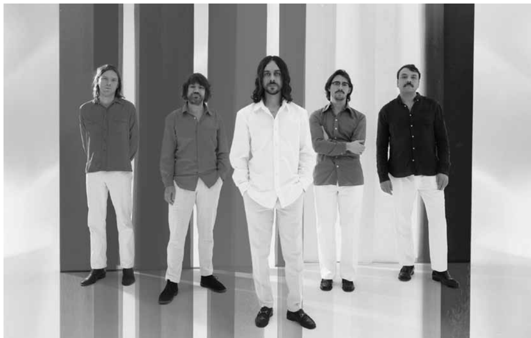
Psychedelischer Rock trifft anatolische Volksmusik. Altin Gün spielt an diesem Freitag, dem 19. Juli um 20 Uhr im Amphitheater in Wiltz im Rahmen des Festival de Wiltz.

Street Art Tour , zone piétonne, Ettelbruck, 10h. Inscription obligatoire : visit-eislek.lu/guided-tour/street-art-tour-in-ettelbruck-in-english