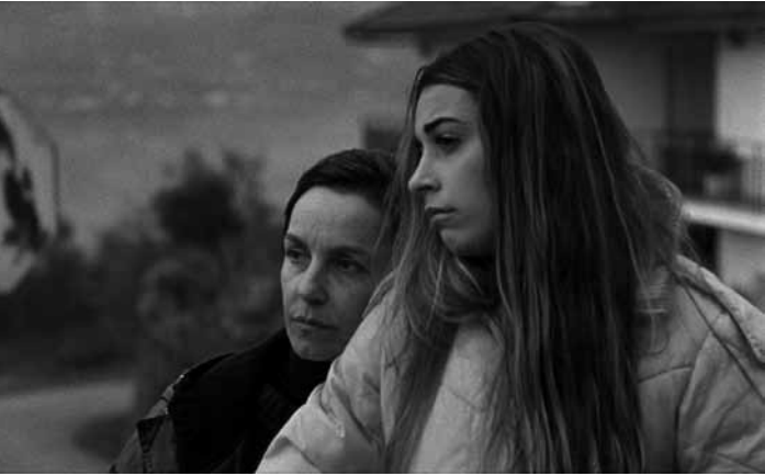
Dans le vieux manoir du nord du Portugal, trois générations de femmes luttent pour leur identité. À la Cinémathèque le dimanche 10 novembre.

ve. 15h - 24h, sa. 12h - 24h, di. 12h - 23h. Vernissage ce sa. 2.11 à 18h.