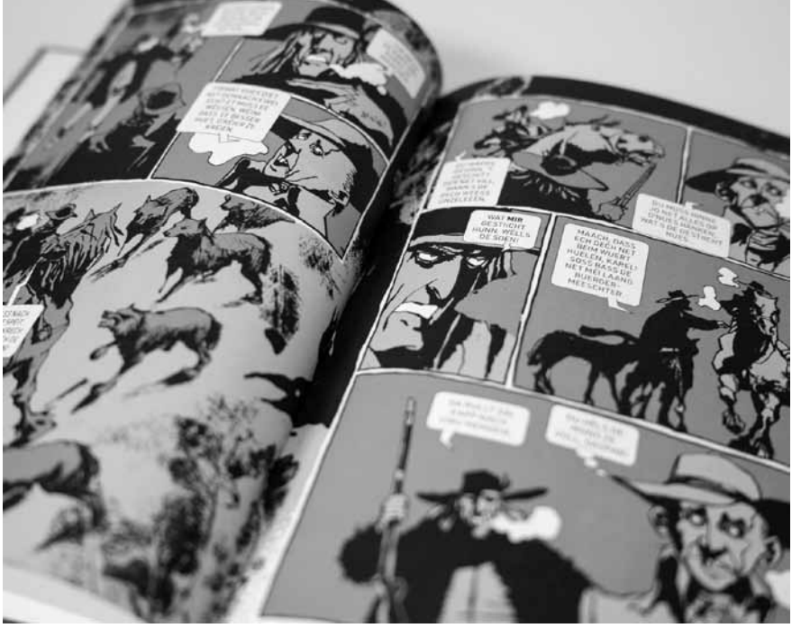
Ee Gudden, e Bësen a vill Leit, déi sech mam Wand dréinen: de passende Stoff fir eng BD.