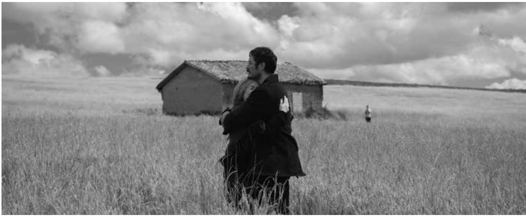
« Horizonte » est une méditation viscérale sur les décennies de conflit brutal en Colombie. Le film raconte l'histoire d'une mère et de son fils et de leur voyage pour rechercher la rédemption. Nouveau au Kinoler, Kulturhuof Kino, Prabbeli, Scala, Starlight, Sura et Utopia.