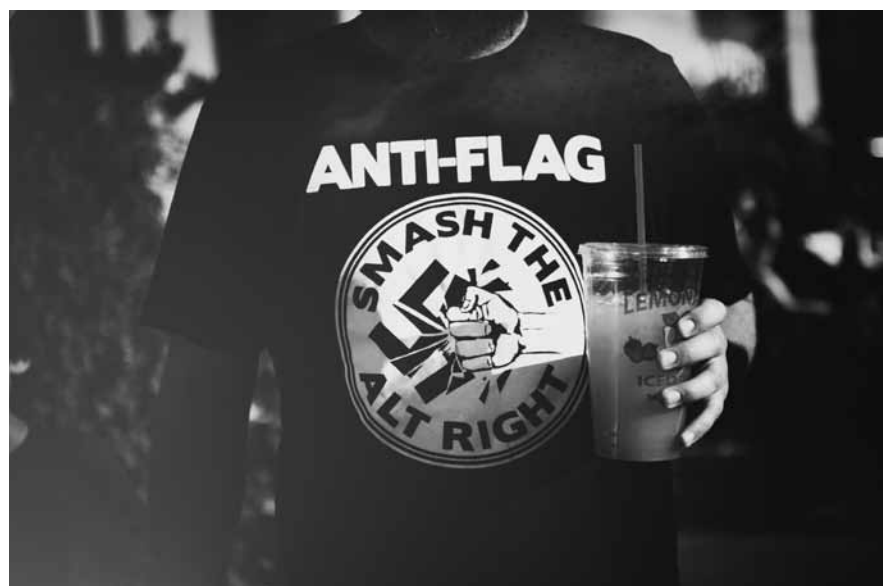
JOHNNY SILVERCLOUD - SMASH THE ALT-RIGHT, CC BY-SA 2.0/WIKIMEDIA

Eine klare antifaschistische Einstellung stünde auch vielen Luxemburger Medien gut.