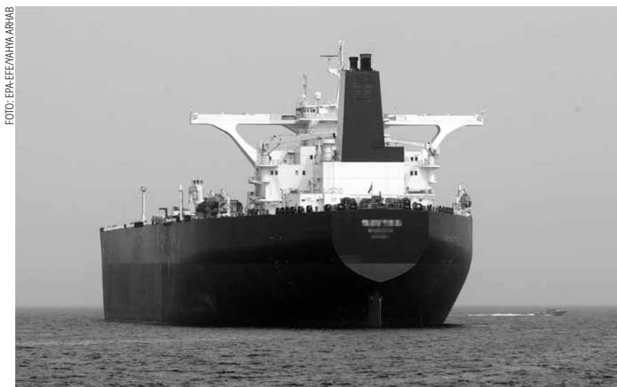
Zumindest aus der Perspektive des Weltmarktes erscheint der russische Weg als Reise ohne Wiederkehr: Deshalb will Wladimir Putin gemeinsam mit China, dem Iran und anderen eine Alternative schaffen.

könnte diese letzte Verteidigungslinie bald bröckeln.“