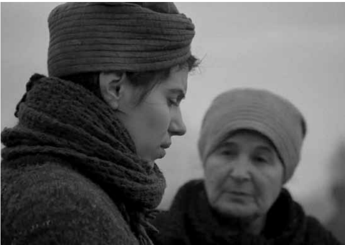
„Des Teufels Bad“ zeigt das bäuerliche Leben des 18. Jahrhunderts und beleuchtet die Herausforderungen und Unterdrückung von Frauen in einer von religiösen Dogmen geprägten Gesellschaft. Neu im Kinopolis Belval und Utopia.

1970 rivalisieren in der irischen Provinz zwei Kindergruppen. Die Auseinandersetzungen dauern nun schon seit Generationen an. Wenn die eine Bande gewinnt, schneidet sie der anderen die Knöpfe von der Kleidung. Doch aus dem harmlosen Kinderspiel wird irgendwann Ernst.