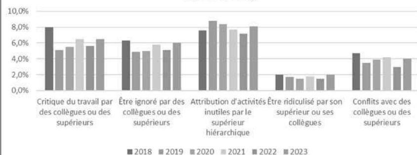
Evolution des comportements de harcèlement moral au Luxembourg

La notion de harcèlement moral au travail a été introduite dans le Code du travail par la loi du 29 mars 2023. Ce texte, le premier du genre, a pour objectif de protéger les salarié-es. Face à la multiplicité des définitions aux contours parfois vagues, le législateur luxembourgeois a retenu la définition déjà en cours dans le service public, car elle est assez générale et englobe un large éventail de situations possibles de harcèlement. Selon la loi, « constitue un harcèlement moral à l'occasion des relations de travail (...), toute conduite qui, par sa répétition, ou sa systématisation, porte atteinte à la dignité ou à l'intégrité psychique ou physique d'une personne ».