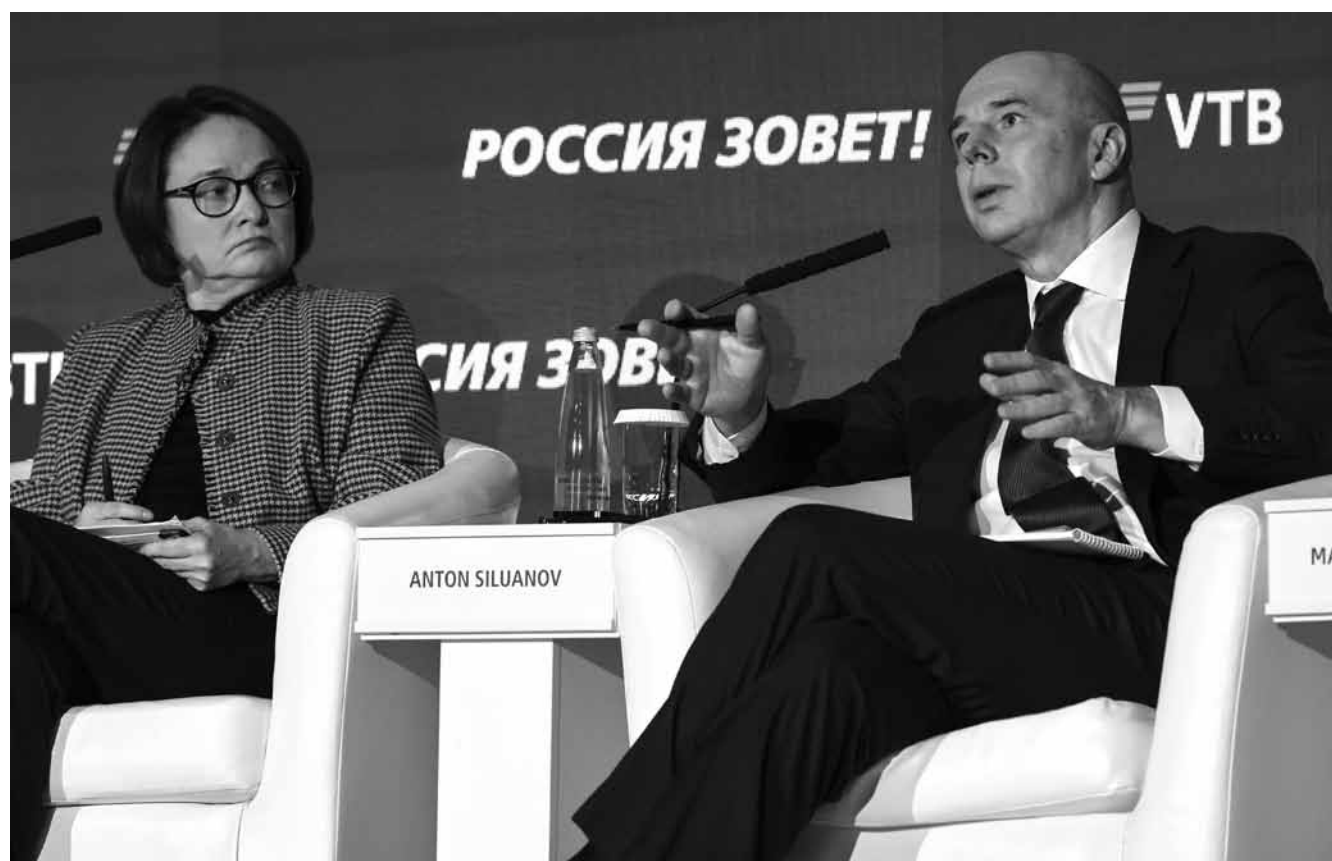
Versucht ihre Institution unabhängig von der Regierung zu halten: Die Präsidentin der russischen Zentralbank, Elvira Nabiullina mit dem russischen Finanzminister Anton Siluanow auf einem Bankenforum Anfang Dezember 2024.

Vor diesem Hintergrund verschärft sich innerhalb der russischen Machtelemente der Streit, wie der gegenwärtigen Entwicklung beizukommen sei.