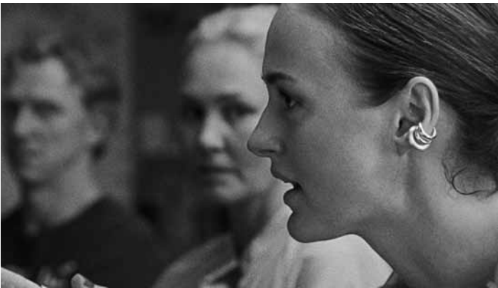
Nach einem ungeklärten Vorfall zwischen zwei Jungen in der Schule versuchen deren Eltern, die Hintergründe zu klären. Armand: neu im Utopia.

Ο ΟΡΓΑΝΟΠΟΙΟΣ (The Luthier) GR 2025, Dokumentarfilm von Yiannis Kostavaras. 76'. O.-Ton + Ut. Ab 12. Org. Ciné-club hellénique