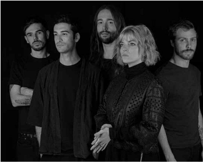
Die luxemburgische Metal-Band Parity stellt am Samstag, dem 19. April um 20 Uhr ihr neues Album „Zero-Sum Game“ in der Rockhal vor.