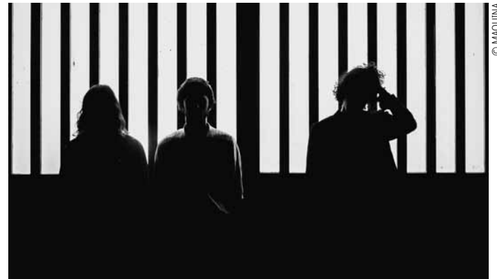
Maquina aus Lissabon lässt sich von Stilen wie Krautrock und Industrial Techno inspirieren und bindet Elemente aus Rock und elektronischer Musik in ihren Sound ein. Die Band gastiert am Mittwoch, dem 16. April um 20:30 Uhr in den Rotondes.

Skreen Brulee + Skuto, hip-hop/indie/rap, Rockhal, Esch, 20h30 . Tel. 24 55 51. www.rockhal.lu