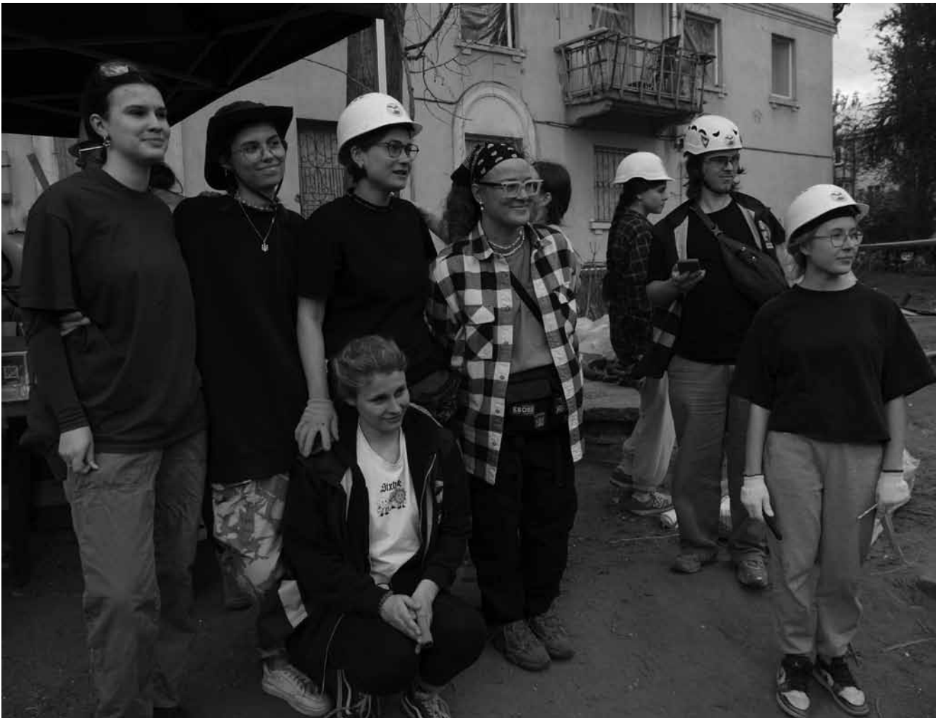
Wollen sich nicht unterkriegen lassen: Junge Freiwillige bei Aufräumarbeiten nach einen Angriff auf den Kyjiwer Stadtteil Swjatoschinski.

Straßenkampf vor. Die ukrainische Regierung gab sogar eine Anleitung heraus, wie man solche Brandbomben bastelt. Normalerweise bestehen sie aus Benzin und Heizöl, hier hatte man jedoch ein eigenes Gemisch mit Styropor. Obwohl die Rede vom „Molli“ längst Eingang in die Popkultur gefunden hat, ist er vor allem eine furchterregende Waffe, selbst wenn man in einem vermeintlich gut geschützten Panzer sitzt. Der Nachteil ist, dass man sich seinem Ziel auf Wurfdistanz nähern muss. Während die einen darauf hinwiesen, ein Einsatz könne auch im ukrainischen Fall gegen Kriegsrecht verstoßen, wurde der Brandsatz zugleich Gegenstand kulturanthropologischer Studien: als Beispiel erfolgreicher Selbstorganisation.