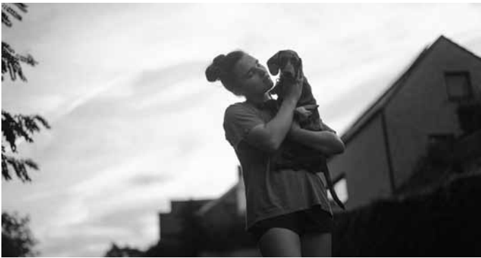
An einer Tennisakademie gerät Julies Trainingsalltag ins Wanken, als ihr Coach wegen seiner Methoden suspendiert wird. „Julie zwijgt“, neu in fast allen Sälen.

Islands D 2025 von Jan-Ole Gerster. Mit Sam Riley, Stacy Martin und Jack Farthing. 123'. O.-Ton + Ut. Ab 6. Kinopolis Belval und Kirchberg Tom war einst Profi-Tennisspieler. Heute ist der 40-Jährige als Trainer in einem Hotel auf Fuerteventura angestellt. Um der Monotonie zu entfliehen bleiben ihm Alkohol und flüchtige Affären. Als