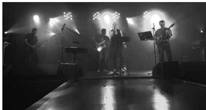
Die Band Blue Moose spielt an diesem Samstag, dem 10. Mai, um 20 Uhr im Café Club Ancien Cinema in Vianden.