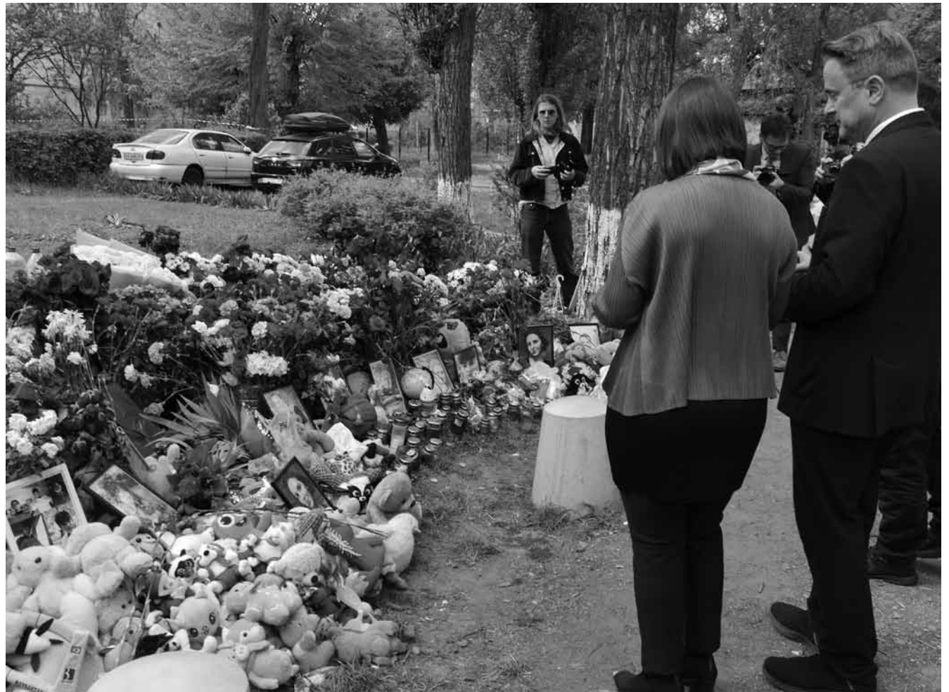
Gedenken an die Opfer eines russischen Raketenangriffs Ende April auf Kyjiw: Ministerin Yuriko Backes (zweite von rechts) und ihr Kollege Xavier Bettel (rechts).

Meist finden die Angriffe nachts statt. Nicht so am 8. Juli 2024. Der ukrainischen Luftabwehr gelang es