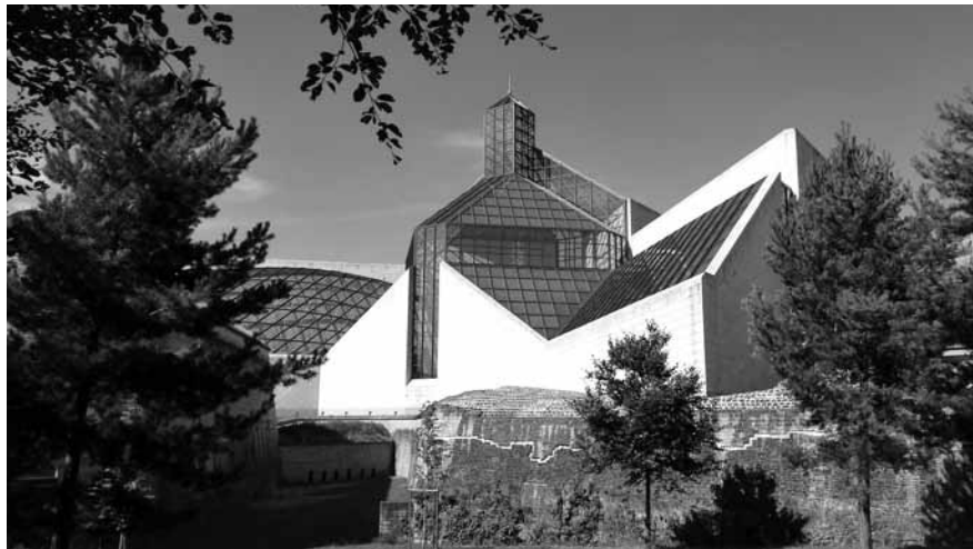
Die Mudam-Affäre hat in den vergangenen Wochen noch an Brisanz gewonnen.

Die Oppositions- politikerin bezog sich auf Ereignisse, die sich bereits am 23. April in einer Sitzung der Kulturkommission abgespielt hatten. Auf der Tagesordnung stand damals eine Auseinandersetzung mit den mutmaßlichen Missständen im Mudam (siehe Kasten). Dabei befassten sich die Mitglieder der Kommission mit zwei Dokumenten, die Thill vorlagen. Es handelte sich zum einen um eine Bestandsaufnahme, die das Beratungsunternehmen „Qualia“ zwischen Septem-