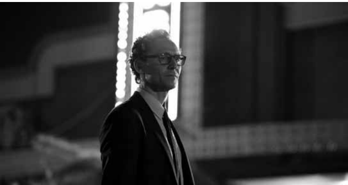
„The Life of Chuck“ erzählt chronologisch rückwärts vom Leben eines gewöhnlichen Mannes, beginnend mit dessen Tod. Neu in fast allen Sälen.

Suite à une erreur de réservation, deux familles que tout oppose, ainsi qu'un éditeur un peu snob et l'influenceuse qu'il souhaite publier, se retrouvent contraints de partager une sublime maison de vacances. Le choc des cultures est immédiat, entre habitudes incompatibles et personnalités affirmées. Pourtant, malgré les tensions et quiproquos, ces vacances forcées prennent une tournure inattendue.