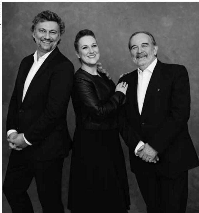
Jonas Kaufmann, Diana Damrau und Helmut Deutsch präsentieren am Mittwoch, dem 18. Juni, um 19:30 Uhr in der Philharmonie Luxembourg Lieder von Mahler und Strauss.