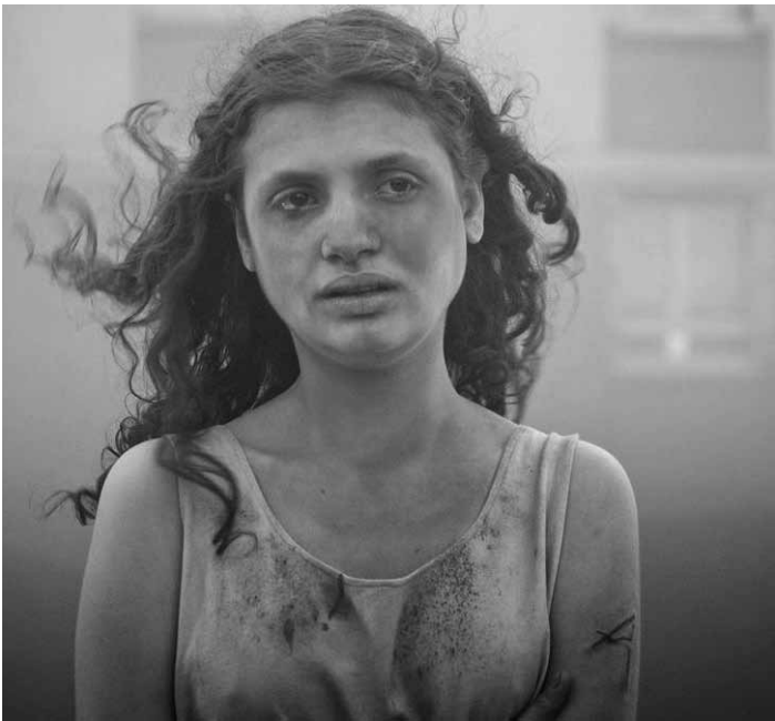
Dans les années 1980 au Havre, Alpha, adolescente isolée, voit sa vie bouleversée par un tatouage mystérieux. « Alpha » : nouveau à l'Utopia.

Un programme des films burlesques les plus déjantées du Cinéma forain, affichant Artheme qui avale sa clarinette, la famille japonaise des Kiriki et leurs drôles de pyramides humaines défiant la loi de la pesanteur, une perruque s'envolant vers la pointe de la tour Eiffel ou un bain de pieds a la moutarde finissant en véritable catastrophe.