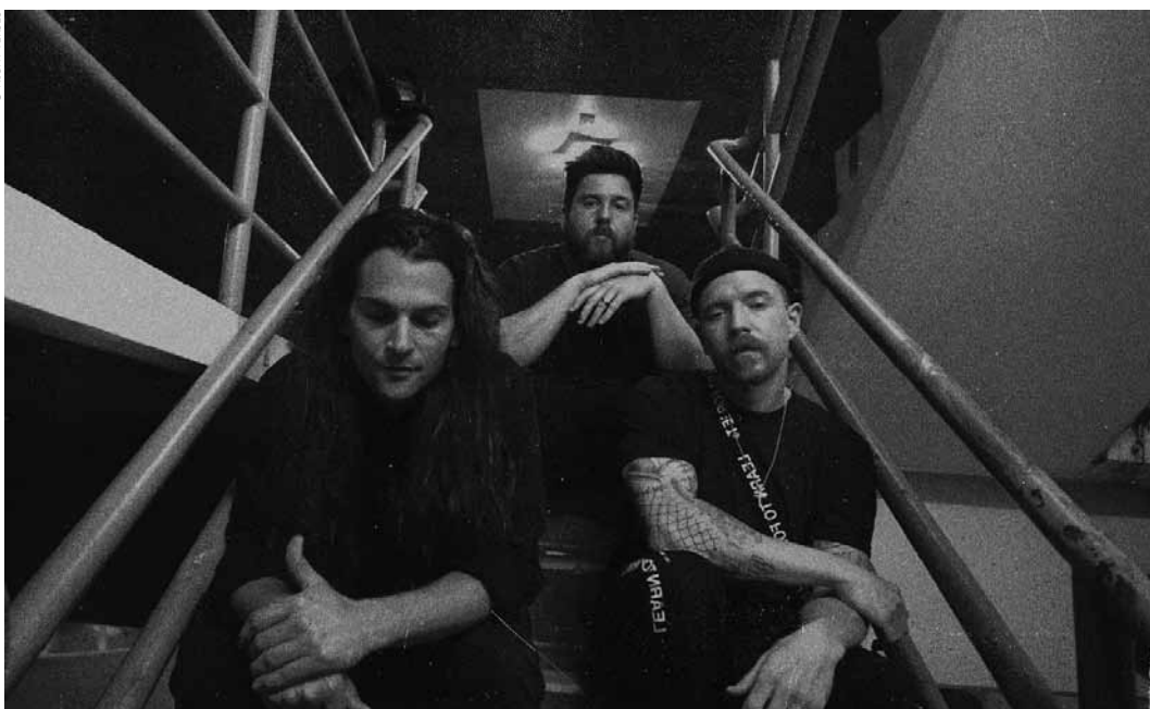
Die amerikanische Rockband Night Verses tritt am Sonntag, dem 14. September, um 20:30 Uhr in der Rockhal auf.

Lebanon Hanover , dark wave, support: Desinteresse, Kulturfabrik, Esch, 20h. Tel. 55 44 93-1. www.kulturfabrik.lu