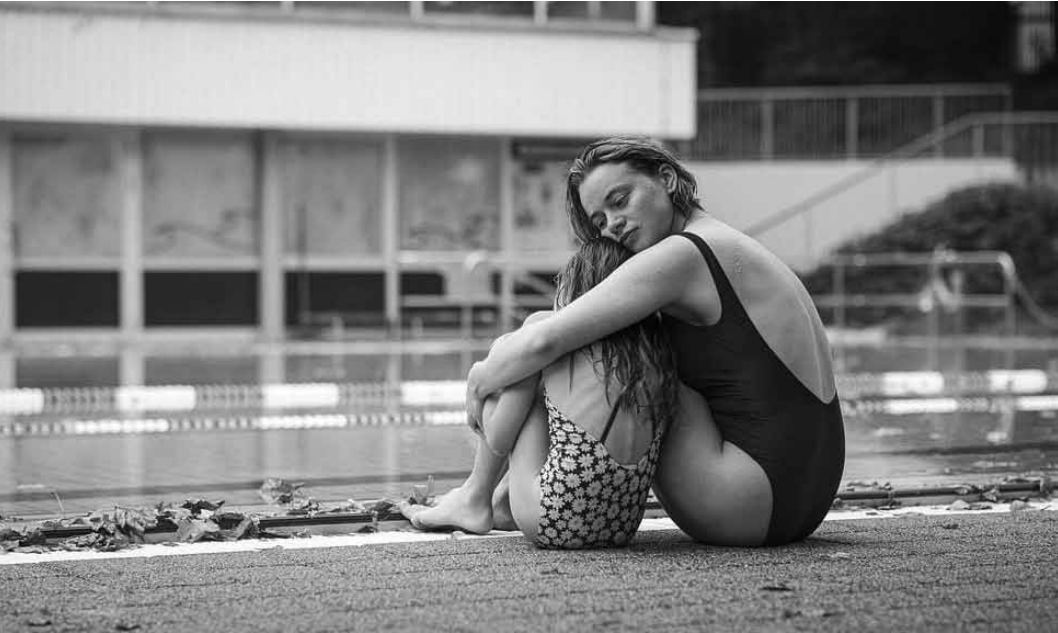
Angesichts ihrer alkoholkranken Mutter übernimmt Tilda die Verantwortung für ihre Familie: „22 Bahnen“, neu in fast allen Sälen.

Terminal F 2025, documentaire de Skudy et Yann Cornières. 120'. V.o. À partir de 6 ans. Kinopolis Belval et Kirchberg, 5.9 à 20h et 6.9. à 16h45. Seize créateurs de contenu, répartis en huit duos, sont mystérieusement conviés dans un aéroport abandonné pour prendre part à la plus grande chasse à l'homme jamais filmée. Pendant 48 heures, ils devront survivre aux traqueurs dirigés par un mystérieux « Maître du Jeu » dont l'identité restera secrète.