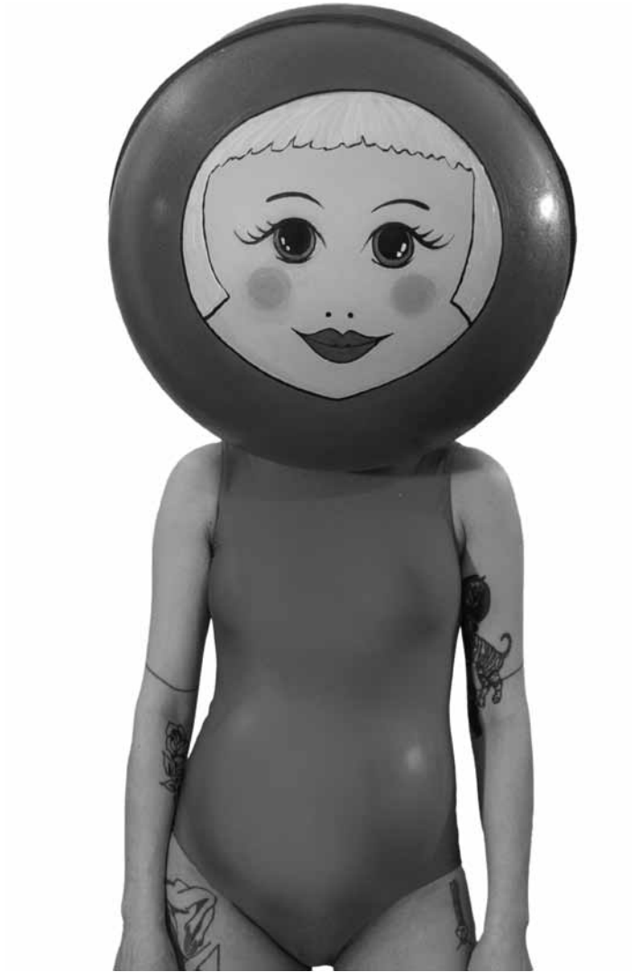
In der Ausstellung „Mute“ thematisiert Darja Linder Entwurzelung, vererbtes Schweigen und Zuschreibungen an weibliche KĖrper. Zu sehen vom 13. September bis 9. November im Centre d'art Dominique Lang in Dudelange.

Studierende der HBKSaar: Party, Party! Soziokulturelle Perspektiven auf zeitgenĖssische Feierkultur Gruppenausstellung, Werke u. a. von Alin Gnettner, Meira Kiefer und Julian Wagner, KuBa - Kulturzentrum am EuroBahnhof e.V. (Europaallee 25),