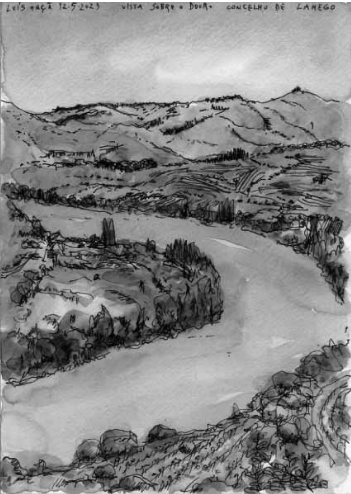
© LUÍS GAIVÃO ET LUÍS ANÇÃ

L'ambassade du Portugal et le centre culturel portugais Camões présentent l'exposition « Desenhos dos livros de jazz » de Luís Gaivão et Luís Ançã, du 17 septembre au 15 octobre.