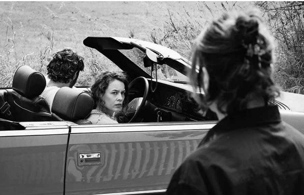
Laura überlebt einen Unfall und kommt bei einer fremden Familie unter – doch etwas stimmt nicht. „Miroirs No. 3“: neu in fast allen Sälen.

Downton Abbey: The Grand Finale UK 2025 von Simon Curtis. Mit Michelle Dockery, Hugh Bonneville und Laura Carmichael. 123'. O.-Ton + Ut. Ab 12. Kinepolis Belval und Kirchberg, Kinoler, Kulturhuef Kino, Kursaal, Le Paris, Orion, Prabbeli, Scala, Starlight, Sura, Utopia, Waasserhaus England im Jahr 1930: Als Lady Mary sich scheiden lässt, sorgt das für einen öffentlichen Skandal. Die Oberschicht droht, sich von der Familie Crawley abzuwenden. Doch der Earl of Grantham, Robert, und seine Frau Cora können ihre Tochter nicht verstoßen. Auch ihre Schwester Edith will helfen. In dieser schwierigen Zeit reist zudem Coras amerikanischer Bruder Harold Levinson an, der Bankrott ist und Hilfe benötigt.