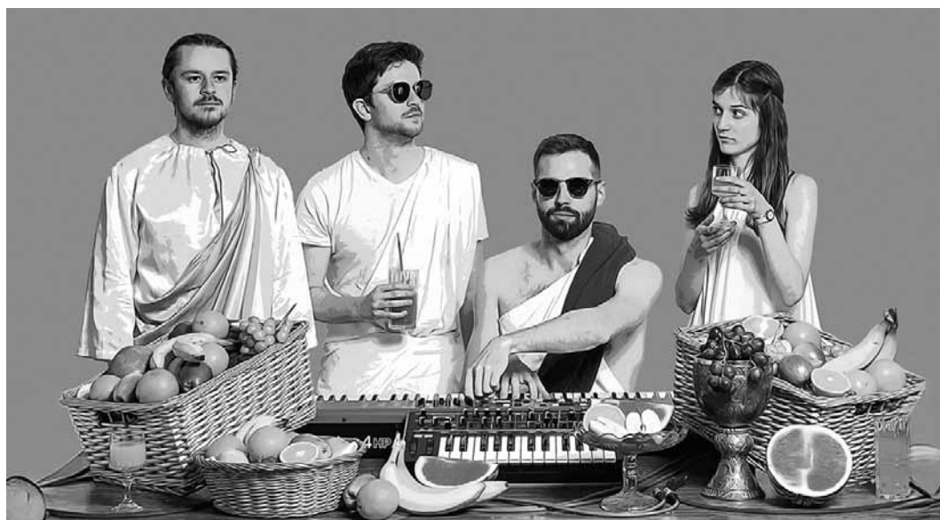
An diesem Samstag, dem 29. November, bringen Between Shelves ihre Funk-Grooves und elektronischen Sounds um 20:30 Uhr in die Rockhal.

Jazz wird's deutsch , Tufa, Trier (D) , 20h. Tel. 0049 651 7 18 24 12. www.tufa-trier.de