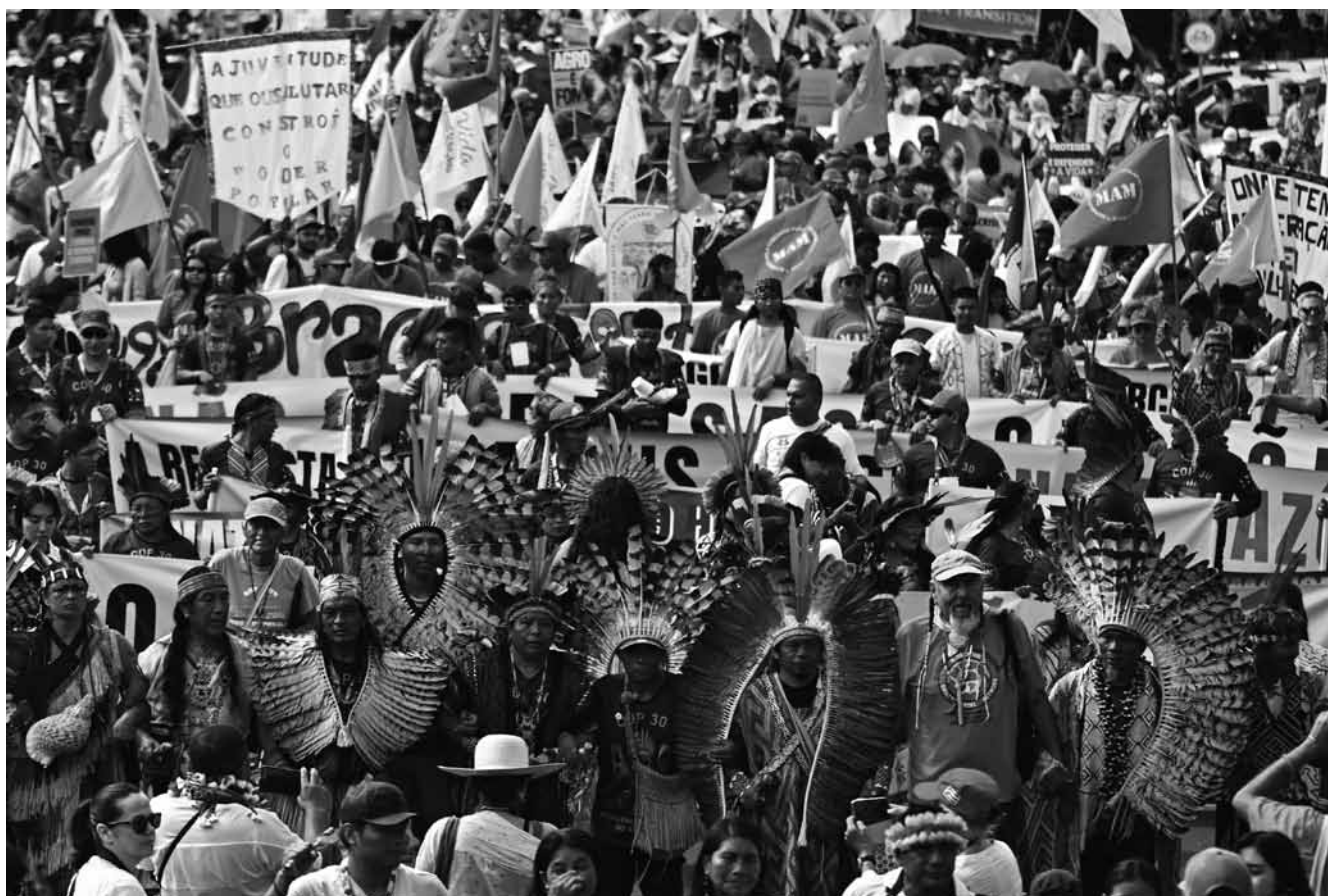
Zum ersten Mal seit drei Jahren wurde der 30. Klimagipfel wieder laut mit Aktionen und Protesten der indigenen und lokalen Bevölkerungsgruppen, Landwirt*innen, Aktivist*innen und NGOs. Bis zu 70.000 Personen nahmen am 15. November an Demonstrationen teil.

gangenen Jahren Jahren waren damit meistens „Large Language Models“ (LLMs) gemeint, die auch das Fundament für Chatbots wie „ChatGPT“ bilden. Angesichts des hohen Energie- und Wasserverbrauchs von Rechenzentren, in denen LLMs „trainiert“ und betrieben werden, fragte die woxx nach, wie hoch der Energieverbrauch und die damit einhergehenden Emissionen des Rio Changemakers-Marktplatzes seien. Die Antwort: man werde dies alles erst noch entscheiden. Dabei sollen aber „Standortkriterien, Einflüsse auf die Umwelt und geopolitische Faktoren“ eine Rolle spielen.