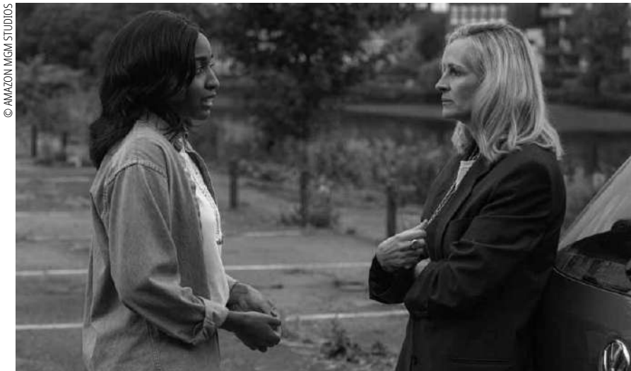
Besonders stark ist der Film in der Darstellung der komplizierten Beziehung zwischen Alma und Maggie.