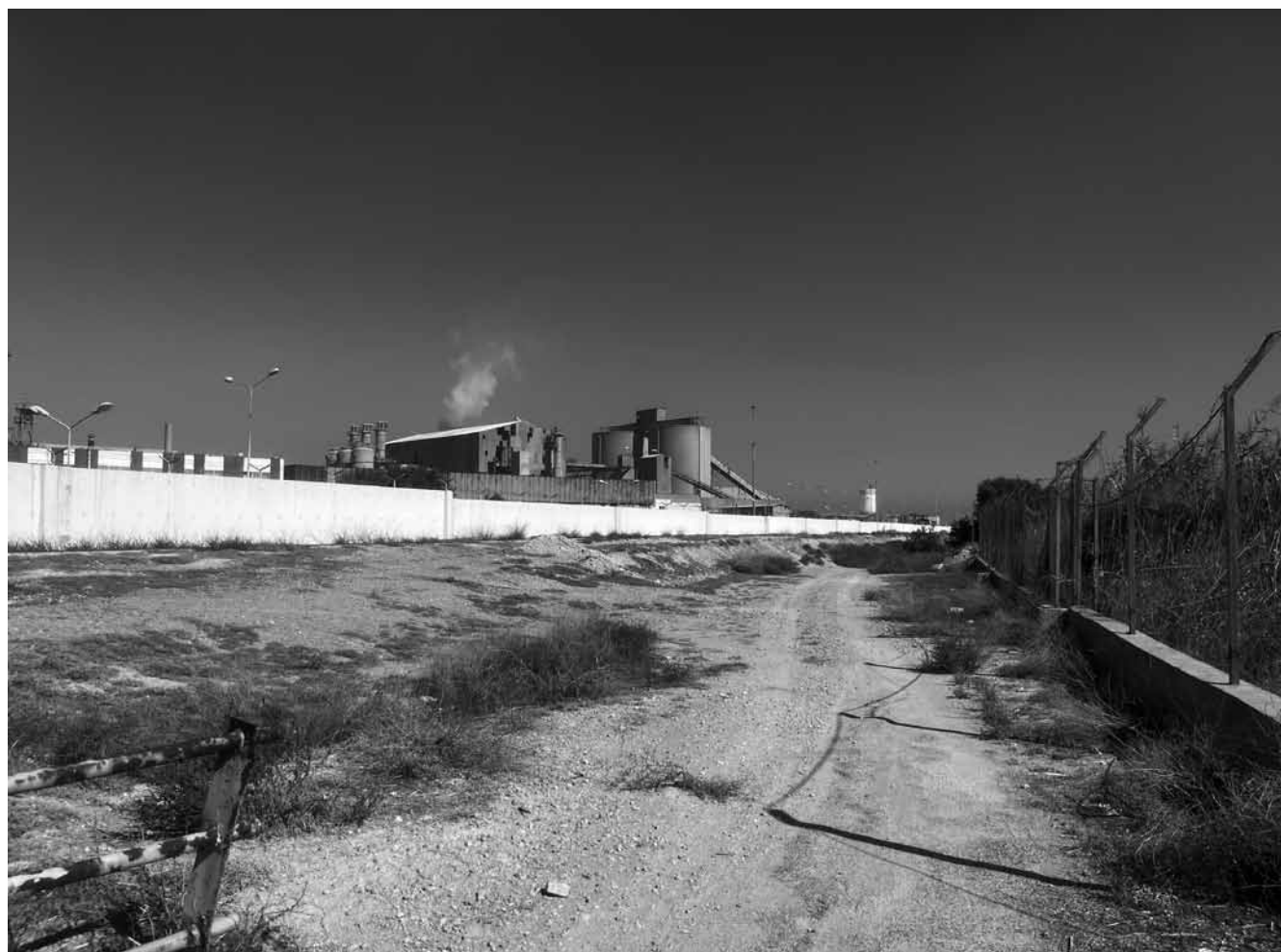
Le Groupe chimique Tunisien a profondément modifié l'environnement de la ville de Gabès.