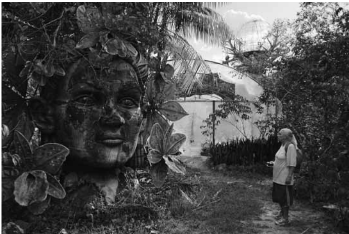
Une femme âgée fuit l'ordre de déménager et traverse l'Amazonie. « O último azul » : nouveau à l'Utopia.

D/USA 2022 von Edward Berger. Mit Felix Kammerer, Albrecht Schuch und Aaron Hilmer. 147'. O.-Ton + eng. Ut. Théâtre des Capucins, Fr., 28.11., 20h15. Während des Ersten Weltkriegs schreiben sich der Teenager Paul Bäumer und seine Freunde Albert und Müller freiwillig in die deutsche Armee ein. Doch ihre anfängliche Begeisterung währt nicht lange. Beim Überlebenskampf lernen sie das wahre Gesicht des Krieges kennen.