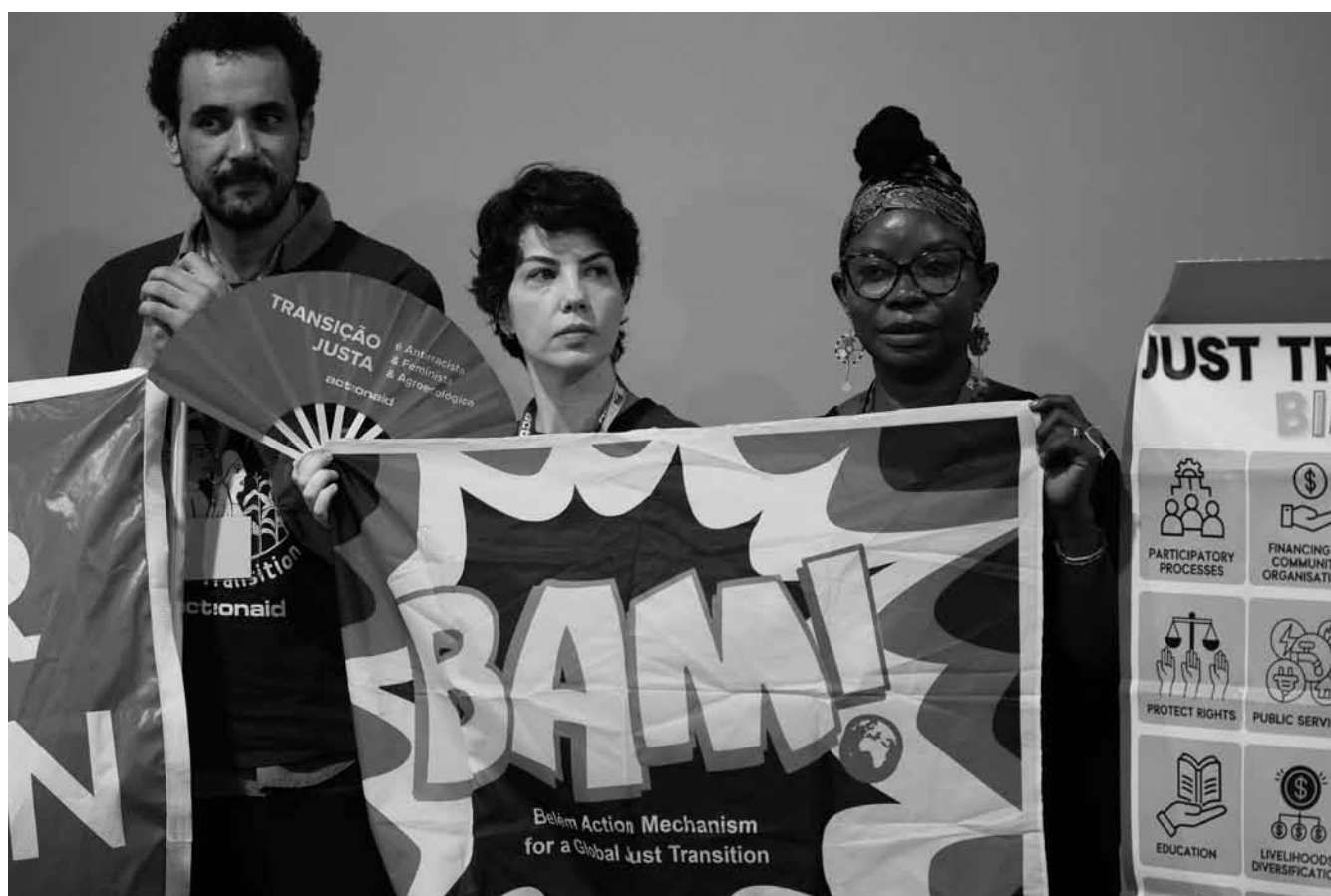
Der Druck der Aktivist*innen hatte auf der diesjährigen COP immerhin einen großen Erfolg: Ein Mechanismus für die gerechte Transition wurde abgestimmt.

len auf der COP31 erneut besprochen werden. Bis dahin organisiert Kolumbien zusammen mit den Niederlanden im April eine eigene internationale Konferenz zum Ausstieg aus fossilen Energien. Die Enttäuschung um den Gipfel in Belém müsse im Kontext der Erwartungen gesehen werden, so Raymond Klein von der ASTM. „Verglichen mit den Erwartungen war etwa die COP28 in Dubai ein Erfolg und die COP30 leider ein Scheitern. Insgesamt waren beide wohl einfach mittelmäßig.“