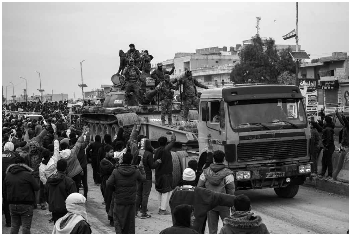
Die syrische Armee rückt nach dem Abzug der kurdischen Kämpfer der SDF am 17. Januar in die Region um Aleppo ein: Von der arabischen Bevölkerung werden die Regierungstruppen als Befreier gefeiert.

Der Niedergang Rojavas begann mit Kämpfen um zwei kurdische Viertel in Aleppo, die man aus heutiger Sicht als Auftakt zu einem länger vorbereiteten Großangriff sehen kann. Der Zusammenbruch der SDF kam