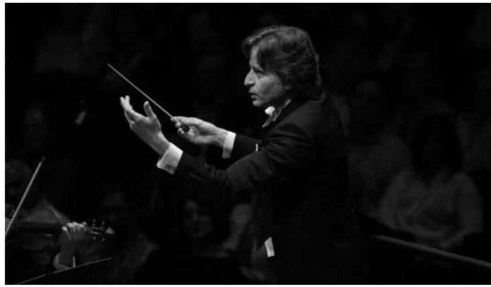
Le Toronto Symphony Orchestra, dirigé par Gustavo Gimeno, se produira le lundi 2 février à 19 h 30 à la Philharmonie.