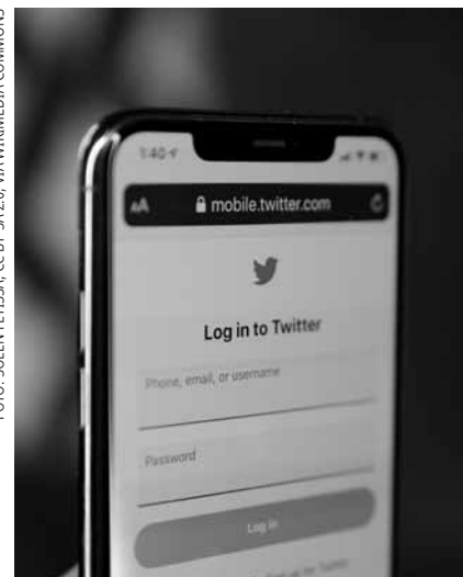
Twitter war einmal: Mittlerweile verlassen sogar Politiker*innen das einst heißgeliebte soziale Netzwerk, das auf „X“ umgetauft wurde.