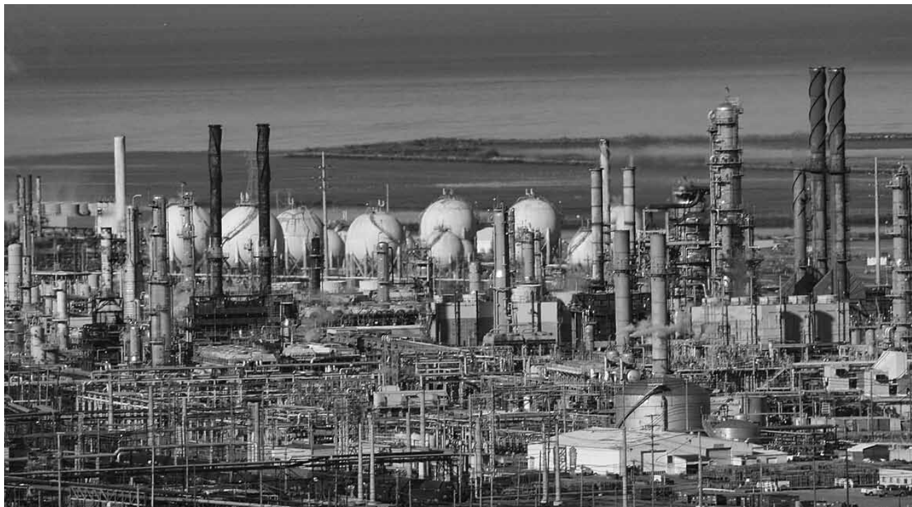
La raffinerie Chevron Richmond, en Californie. La multinationale américaine du pétrole figure parmi les acteurs ayant œuvré à détricoter la directive devoir de vigilance selon le rapport de Somo.

Parmi les onze multinationales incriminées par l'ONG, on trouve les majors pétrolières américaines Chevron et ExxonMobil, mais aussi la française