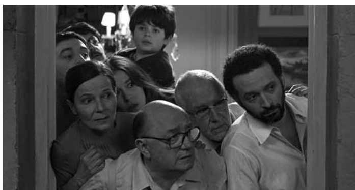
« La cache » est un portrait de famille excentrique qui se déroule pendant les manifestations de mai 1968 à Paris. Nouveau dans presque toutes les salles.

Judy Bernly, Violet Newstead und Doralee Rhodes arbeiten im Unternehmen Consolidated, in dem sie alle unter ihrem Chef Franklin M. Hart Jr. leiden. Als er jedoch das Gerücht in die Welt setzt, er habe mit der verheirateten Doralee geschlafen, platzt den drei Frauen der Kragen.