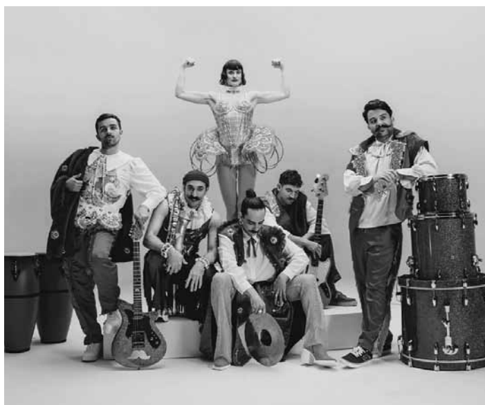
Le groupe français de pop Deluxe se produira le samedi 14 février à 20 h à la Rockhal.

Skinny Lee Blues Band , jazz, Liquid Bar, Luxembourg , 20h30. Tél. 22 44 55. www.liquidbar.lu