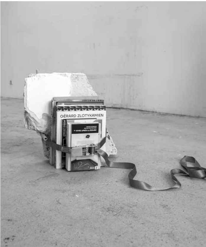
L'exposition « ΙΣΤΟΣ / WEB – Contemporary Artists' Books », réunissant seize artistes luxembourgeois-es et grec-ques autour du livre d'artiste entre matérialité et numérique, se tient du 24 avril au 21 juin au Ratskeller du Cercle Cité.

Marie-Claude Deffarge und Gordian Troeller: Keine Bilder zum Träumen Fotografie und Film, Pomhouse (1b, rue du Centenaire. Tél. 52 24 24-1), vom 2.5. bis zum 27.9., Mi. - So. 12h - 18h. Eröffnung am Sa., dem 2.5., um 11h.