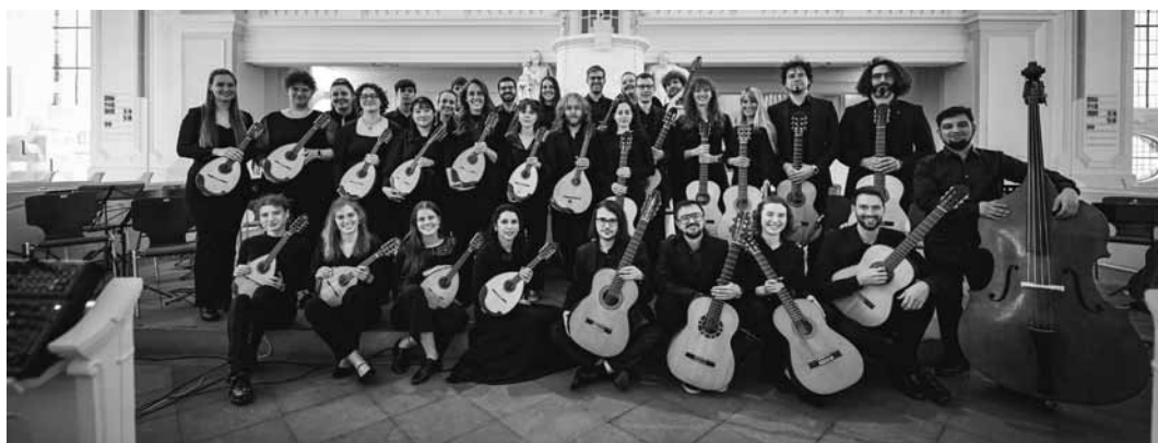
Das europäische Mandolinen- und Gitarrenorchester II Forum Musicale gibt am Sonntag, dem 10. Mai, um 17 Uhr ein Konzert im Mierscher Theater.

Luxembourg, 18h. Tel. 44 74 33 40. www.ewb.lu Reservatioun erfuerderlech: info@ewb.lu