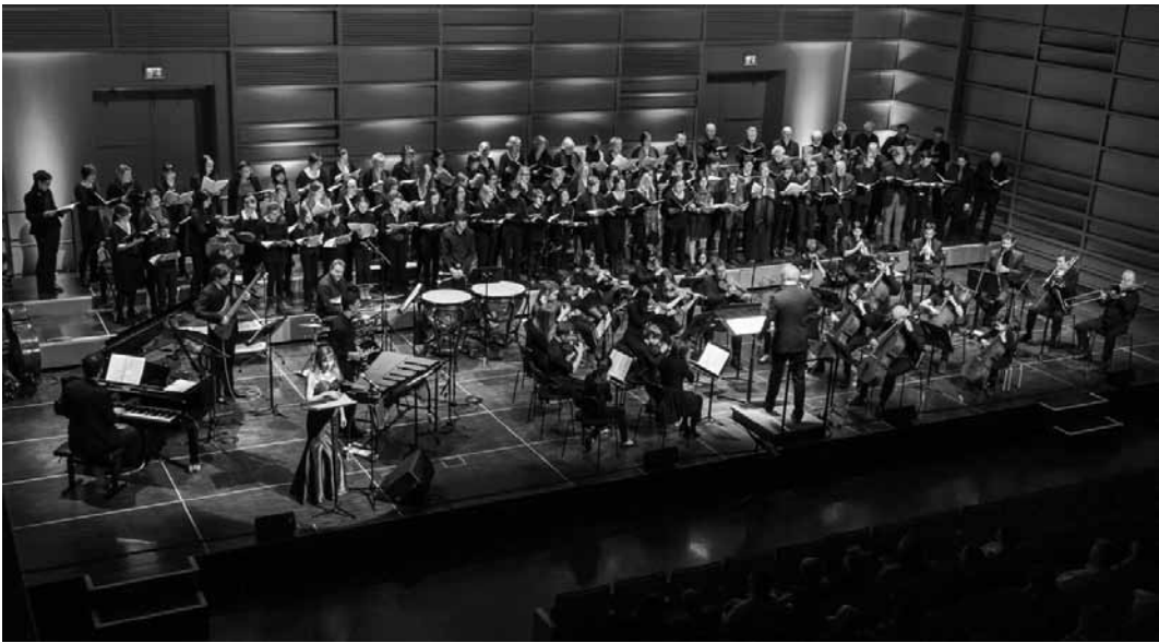
Le jeudi 25 juin à 18 h 30, l'école régionale de musique de la Ville d'Echternach présente avec « Éclats de voix », un concert au Trifolion réunissant sa formation chorale ainsi que ses classes de chant classique et rock/pop.

Lamentation , avec la cie Martha Graham Dance Company, Centre Pompidou-Metz, Metz (F), 14h + 15h. Tél. 0033 3 87 15 39 39. www.centrepompidou-metz.fr