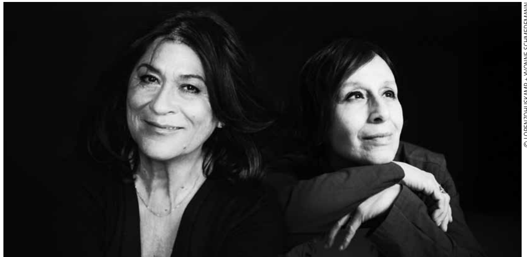
Das Artikuss in Zolwer organisiert am Samstag, dem 27. Juni, um 20 Uhr einen literarisch-musikalischen Abend zu Ehren von Mascha Kaléko unter dem Titel „Nirgendland“ mit dem Etta-Scollo-Trio und der Schauspielerin Eva Mattes.

Menstruatioun an Ernährung: wéi een Zusammenhang? Atelier, Lëtzebuerg City Museum, Luxembourg , 15h. Tel. 47 96 45-00. www.citymuseum.lu