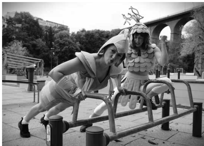
Im Theaterprojekt „Iron Fantasy“ von She Goat setzen sich zwei Wesen mit der Frage auseinander, was es bedeutet, sich stark zu fühlen. Die Aufführung findet an diesem Samstag, dem 13. Juni, um 19 Uhr im Neimënster statt.