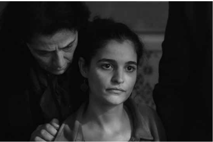
Dans « À voix basse », Lilia se retrouve confrontée aux secrets de sa famille après la mort de son oncle – nouveau à l'Utopia.

USA 2006 von Martin Scorsese. Mit Leonardo DiCaprio, Matt Damon und Jack Nicholson. 151'. O.-Ton + fr. Ut. Théâtre des Capucins, So., 14.6., 10h. Der junge Polizist Billy Costigan aus South Boston wird undercover in das Syndikat des Gangsterbosses Costello eingeschleust. Doch auch Costello hat einen Maulwurf: Der junge Kriminelle Colin Sullivan spioniert für ihn bei der Spezialeinheit der Polizei, die auf ihn angesetzt ist. Als sowohl Gangster als auch Polizei merken, dass sich ein Maulwurf in ihren Reihen befindet, beginnt für Billy und Colin ein hektischer Wettlauf, den jeweils anderen zu enttarnen und selbst unerkant zu bleiben.