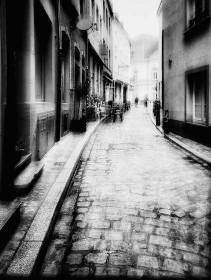
L'exposition « Traces urbaines » présente les photographies de Luc Freichel, réalisées à l'aide de techniques anciennes, à la Millegalerie à Beckerich, du 14 juin au 5 juillet.

Fête de l'amitié , concerts, ateliers pour enfants et stands d'information, parc communal, Hesperange, 11h30.